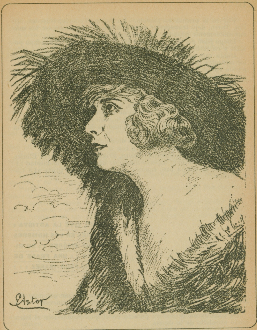
Retrato de Pearl White