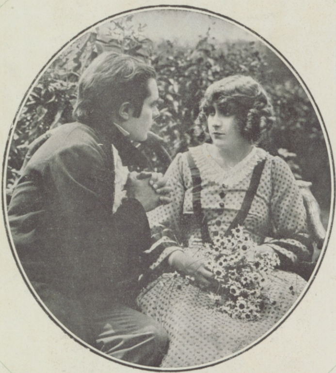
PEARL WHITE en «Flor de Primavera»