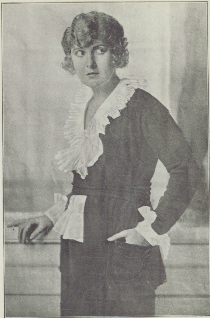
Uno de los últimos retratos de PEARL WHITE