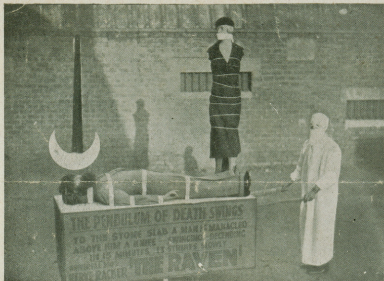
En las calles de Paisley (Norteamérica) ha hecho su aparición esta macabra escena ambulante, que se refiere a la maravillosa cinta Universal basada en una obra de Edgar Poe "EL CUERVO" interpretado por Lugosi y Karloff. ¡La Empresa del cine que ha estrenado dicha obra ha sido felicitada por Carlos Laemmle y ha obtenido el más ruidoso éxito de la Unión con 6 semanas consecutivas de programación agotando las taquillas!

película americana cien por cien, en su forma y en su fondo. Su acción, que tiene por escenario los vastos horizontes del Oeste de los Estados, se presta al desfile de una serie de tipos que siempre son interesantes, siempre distraen por su ritmo dinámico y sus contrastes, aun a los más habituados a este género de películas.