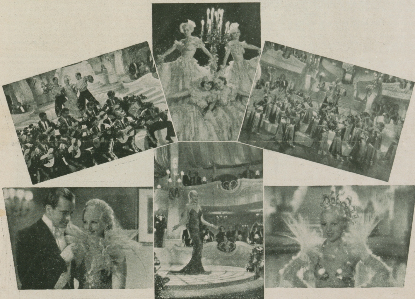
Seis escenas del glorioso film "EL BAILE DEL SAVOY" por Gitta Alpár - Hans Jaray, cuyo fausto trama y melodías constituyen el éxito más ruidoso.

Claude Rains, el actor sorprendente, tiene un papel de cantor de salmos sagrados, que de día hipnotizaba a sus feligreses con la magia de su voz subyugadora... mientras que de noche, trémulo de ansias, su-