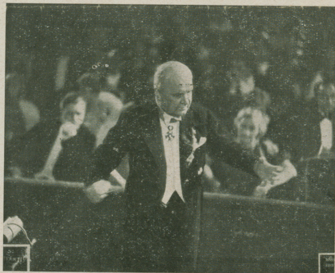
El ilustre compositor Franz Lehár autor de la maravillosa Opereta "Frasquita" dirigiendo el concierto en una escena del clamoroso film.

¡Señor empresario, "FRASQUITA" es la película que sentará a su teatro como la mano a un guante exprofeso, siempre que usted sepa aprovechar la formidable propaganda que su tema le ofrece con su nombre en el elenco y dirección! Franz Lehár dirige personalmente la famosa música ¡no lo olvide usted! ¡Luego, los mejores actores y actrices de la Opera de Praga con la Novotna y el tenor Bollmann a su cabeza forman la vanguardia de un reparto fantástico para tan formidable película!