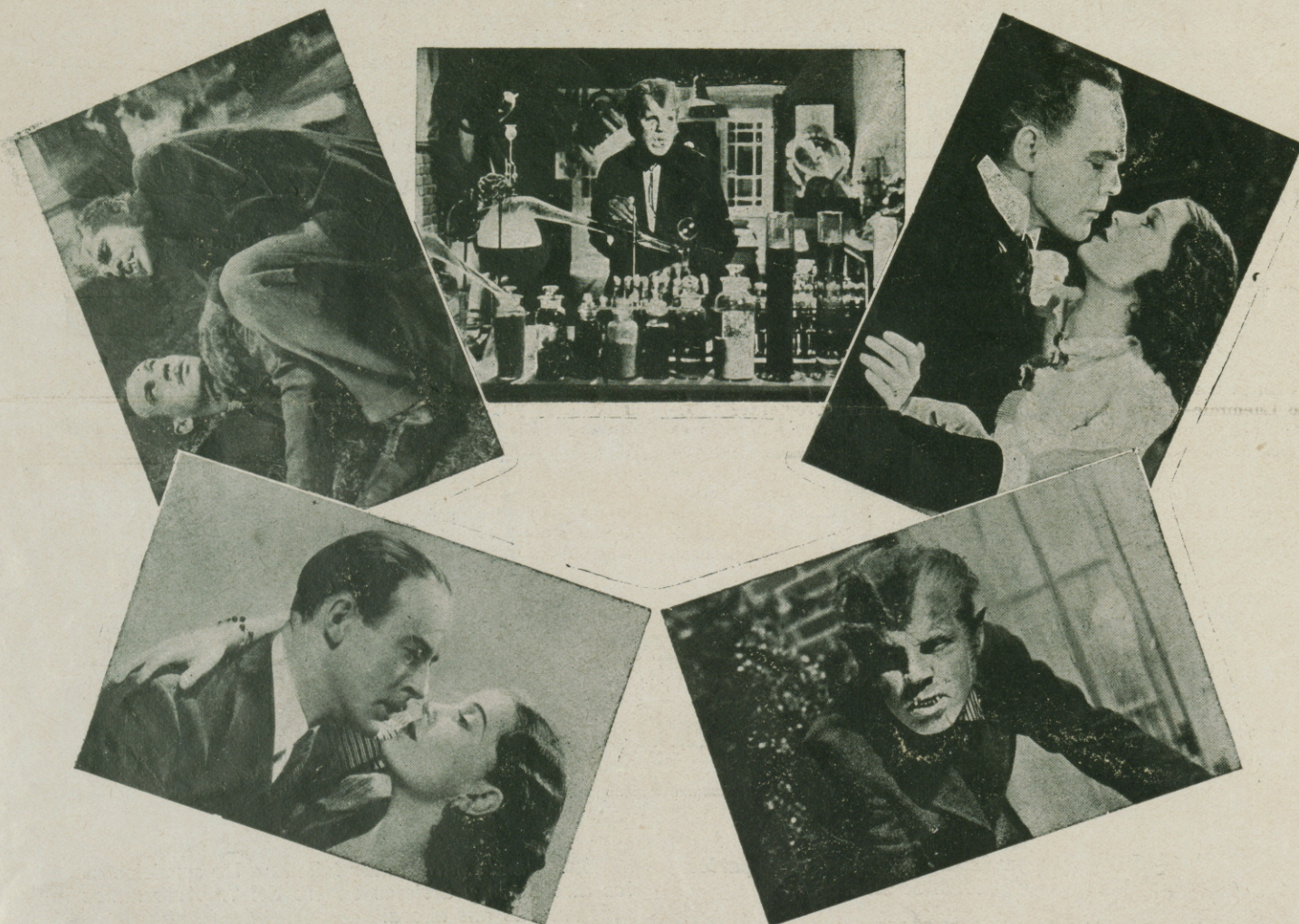
Algunas escenas del film más escalofriante y sensacional del año "EL LOBO HUMANO" por Henry Hull