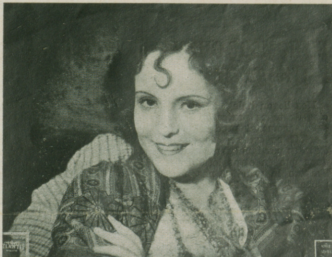
Jarmila Novotná la bellísima "Frasquita" diva fantástica de la Opera Nacional de Praga.

¡Anuncie usted bien esta película y haga de ella una mina de oro para usted!