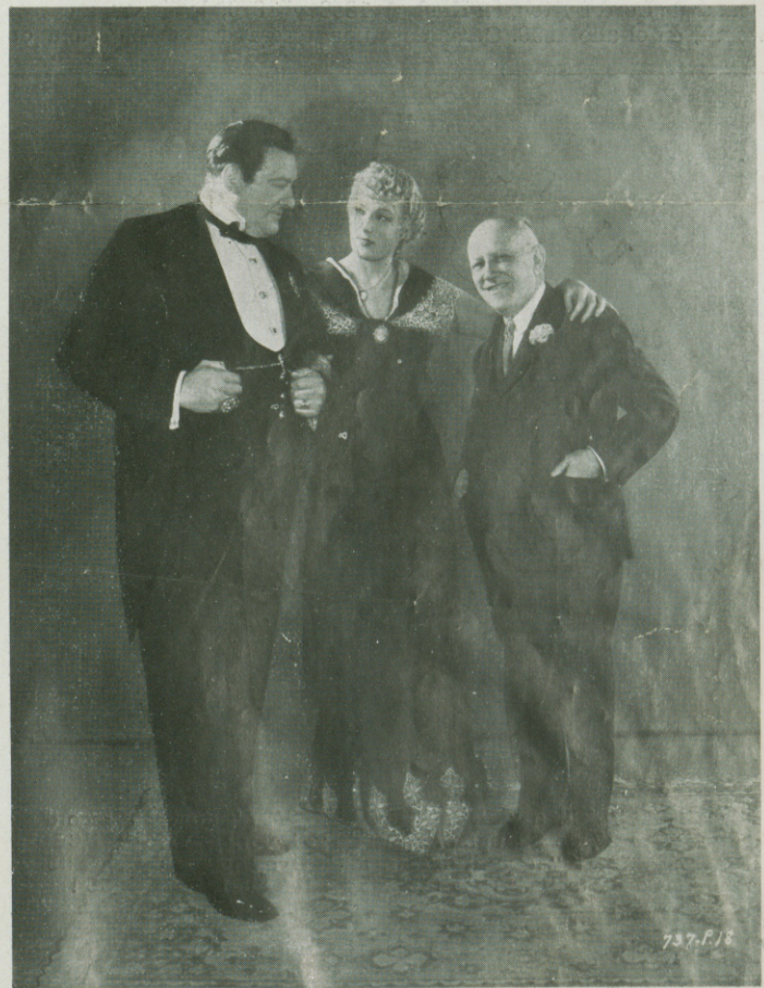
Las dos estrellas de "EL HOMBRE DE LOS BRILLANTES" los famosos EDWARD ARNOLD y BINNIE BARNES son felicitados personalmente por Carlos Laemmle, el presidente de la UNIVERSAL en vista del éxito mundial del gigante film. (De derecha a izquierda: Carlos Laemmle, Binnie Barnes y Edward Arnold).

La película ofrece un ambiente digno del conflicto creado entre ambos países, resultando una cinta emocionante, patriótica, sin rencores, y mezclando la obligación guerrera con el espíritu caballeresco que los españoles han legado a sus hijos de las Repúblicas americanas. Una guerra en gran parte realizada por caballeros del aire, en que lo trágico, lo heroico y lo sentimental se mezclan bajo una dirección fantástica. Así contamos entre sus escenas de suma emoción la de la explosión de un polvorín conteniendo varias toneladas de explosivos de gran potencia, o aquellas otras escenas de luchas aéreas entre aviones de caza de ambos bandos, con el accidente sufrido por Crespo que se estrella con su aparato contra un hangar; los aviadores que se lanzan al espacio con sus paracaídas; el ataque y bombardeo de un gran campo de aviación, durante el cual el célebre "Zorro" ametralla no sólo a los pilotos enemigos sino que barre la pista del