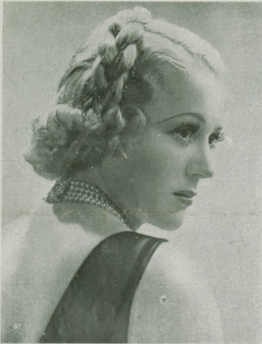
SALLY EILERS que en el magnífico film UNIVERSAL "ALIAS MARY DOW" se destaca como la estrella de vanguardia de la actual temporada.