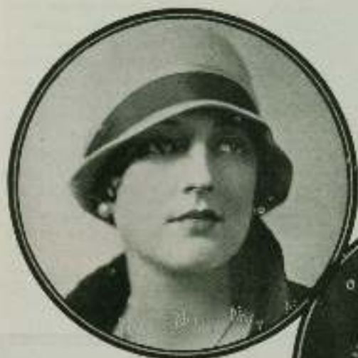
Carmel Myers, luce su clásica belleza en varias poses especiales para Films, y en una escena de la grandiosa cinta "Ben Hur".