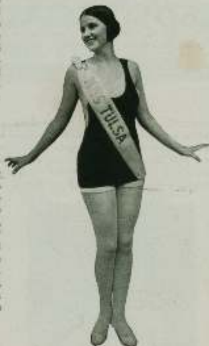
Miss América de 1926

No pueden ustedes cobrarme contribución más que por las propiedades radicadas en Atlantic City; yo vivo en Ventnor City y los dientes van conmigo.