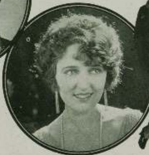
La fotografía de la izquierda es la que hicimos de la notable artista en los estudios del Times.