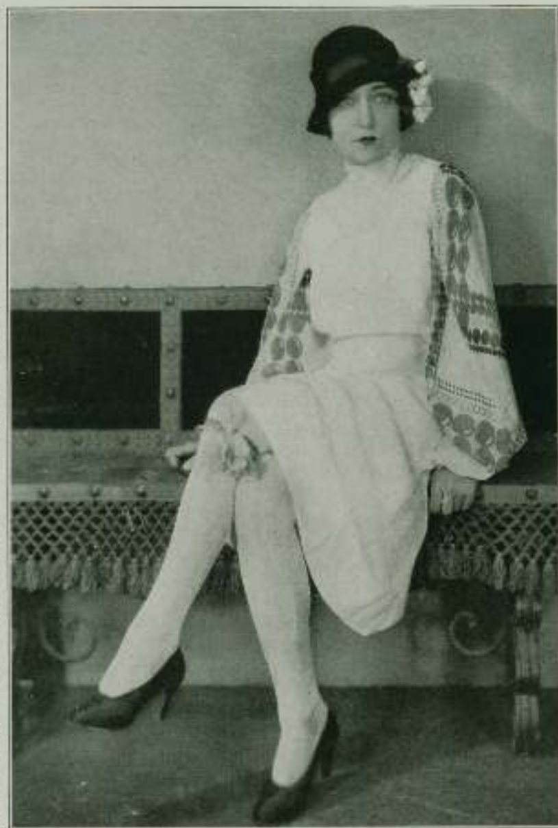
Esta preciosa nena es Dorothy Sebastian, del elenco de la Metro-Goldwyn-Mayer. Fijense ustedes qué cara... qué ojos... y qué bases de sustentación tan lindas para un cuerpecito idem.

permanecieron en el agua sufriendo los rigores de la tempestad y cuando regresaron estaban completamente desahogados, pues habían usado su ropa para tapar heriduras por donde penetraba el agua, poniendo en peligro sus vidas y amenazando destruir los trozos de película ya impresionados.