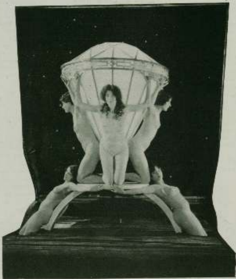
Una verdadera joya

Tanto en los Estados Unidos como en el resto del mundo, la muerte del hombre que durante mucho tiempo fué el