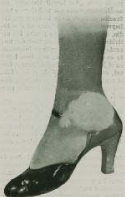
Un detalle de las piernas parlantes, propiedad de la niña de marra.

Uno de los artistas mejor pagados del mundo, Lon Chaney, hizo recientemente una jornada de veinticuatro horas de trabajo cobrando solamente 8