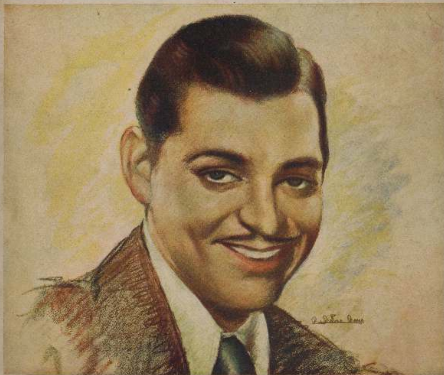
CLARK GABLE, EL INSUPERABLE FLETCHER CHRISTIAN DE REBELION A BORDO, FILM METRO GOLDWIN MAYER

magazine nacional cinematográfico • mayo 1935 • 1 peseta