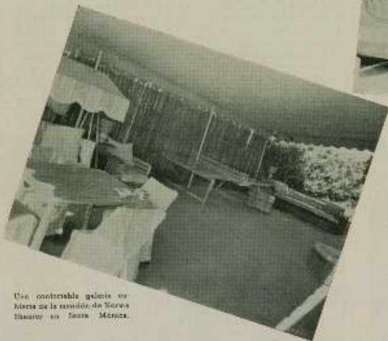
Una confortable galería exterior de la mansión de Norma Shearer en Santa Mónica.