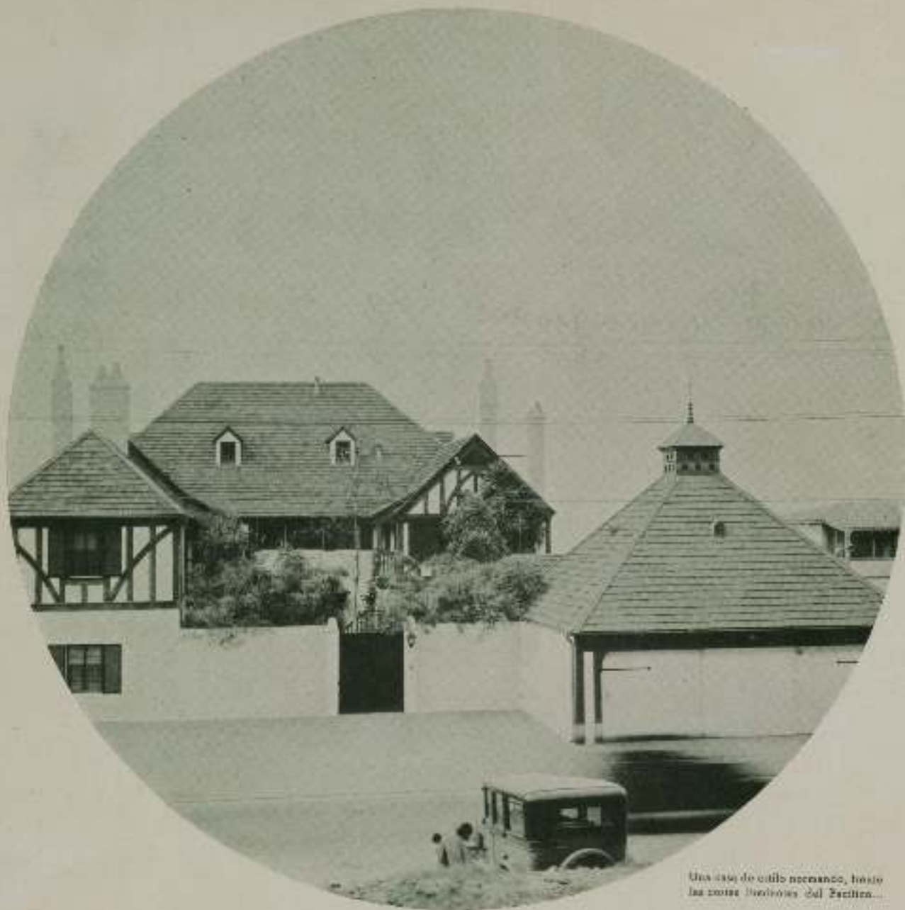
Una casa de estilo normando, hasta las cosas lindosas del Façón...