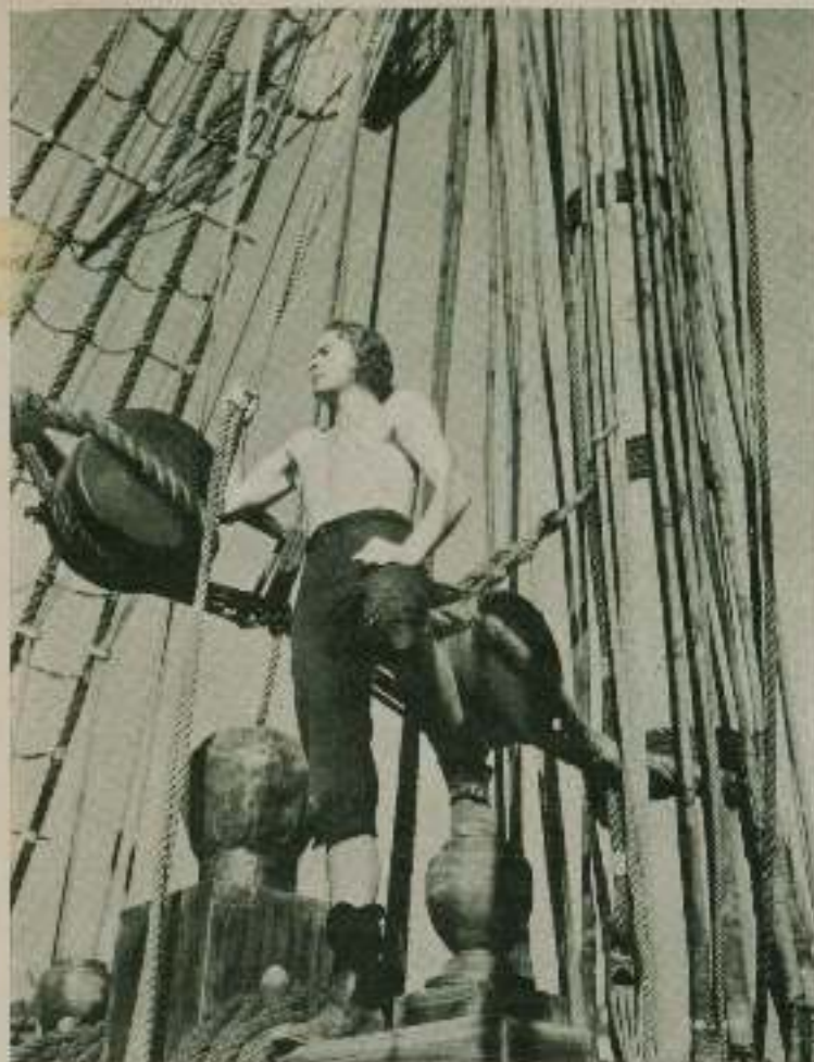
«EL CAPITAN BLOOD»