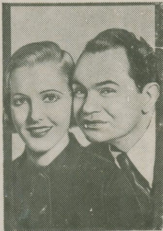
JEAN ARTHUR y EDWARD G. ROBINSON, protagonistas de "Pasaporte a la Fama"

Inmediatamente seguirán otras cinco películas, a fin de que nuestras producciones dobladas puedan empezar a trabajar seguidamente.