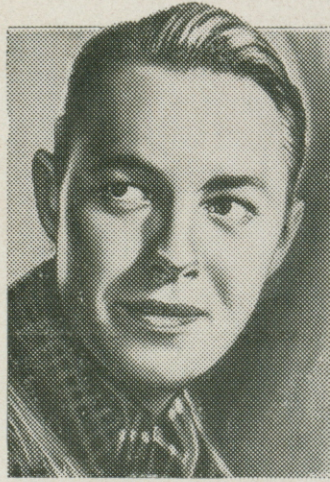
RICHARD CROMWELL protagonista de "Glorias Robadas" con Wallace Ford y Billie Seward

tudes! Luis Alberni de nuevo se manifiesta con una gran labor. ¡Robert Allen llega a la cumbre en su papel romántico!"