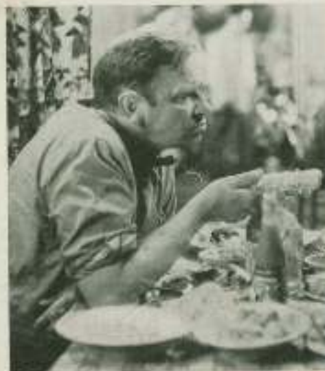
Wallace Beery y Jackie Cooper en una escena de «Chorus» (El Corpeón) film dirigida por King Vidor