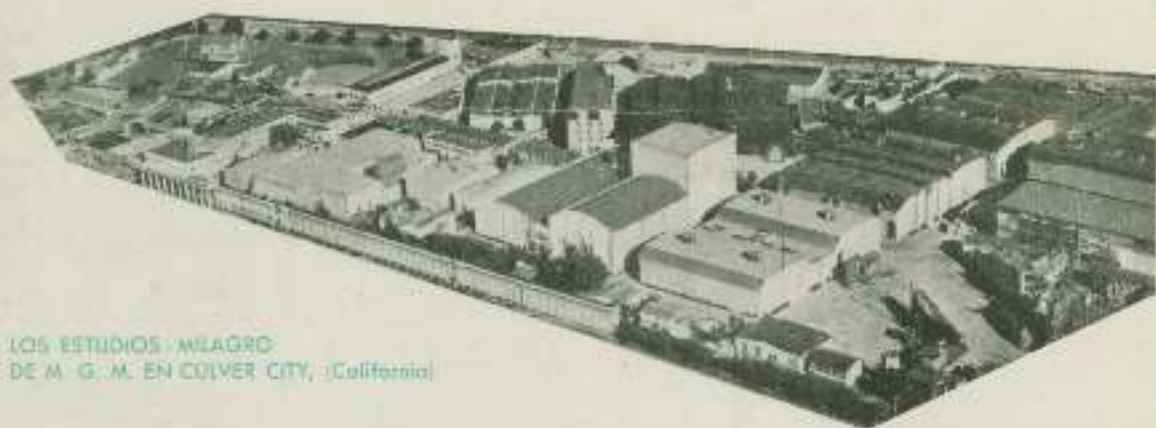
LOS ESTUDIOS MILAGRO DE M. G. M. EN CULVER CITY, California

CUANDO el griterío haya terminado, cuando los adjetivos se hayan agotado, y todas las grandes promesas hayan sido olvidadas, al fin de cada año el empresario confirmará una vez más su inquebrantable confianza en