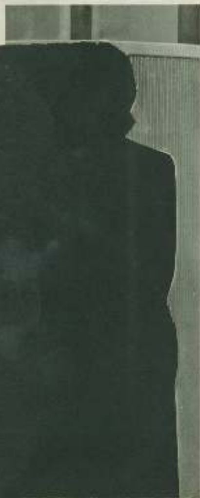
Una reciente y sagaz pose de Joan Crawford