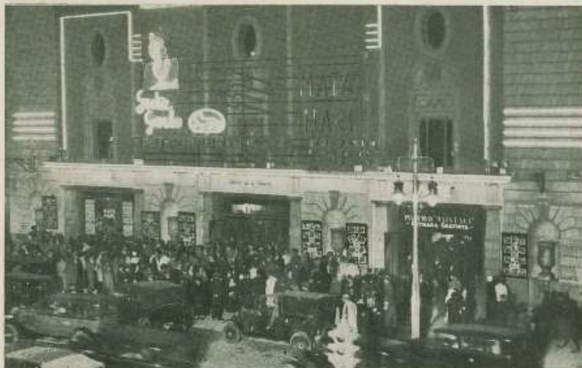
Un ejemplo de fachada luminosa excelente y un ejemplo del éxito de «Mata-Hari» en Madrid a los quince días de haberse estrenado.