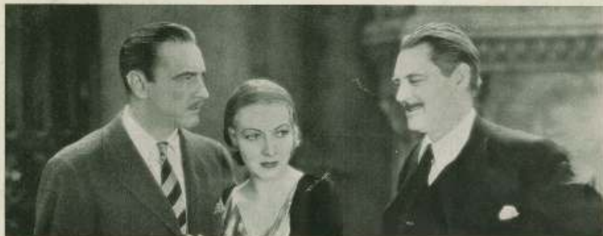
John Barrymore, Karen Morley y Lionel Barrymore en "Arsenio Lupin, el ladrón de guante blanco."

Haga usted inmediatamente una experiencia, proyecte esta mañana mismo sobre la pantalla el foco de una máquina, compruebe usted con gran escrupulosidad si toda la superficie del lienzo queda iluminada por igual, o si quedan zonas oscuras en los extremos. En este último caso procederá centrar debidamente la proyección, lo cual se obtiene algunas veces con los movimientos que pueden imprimirse a los carbones, pero en otras ocasiones exigirá una modificación de la posición de la linterna de proyección que quizá no se halle al debido paralelismo de la pantalla. Esta misma experiencia debe hacerla inmediatamente con la segunda máquina de proyección. Creemos obvio repetir todas las experiencias que deben hacerse con respecto a la proyección, sin duda alguna, usted las conoce tan bien como nosotros y su operador debe practicarlas con cierta periodicidad. Nuestro mayor interés no consiste en enseñarle lo que usted seguramente ya sabe, sino en recordarle que no deje usted de efectuar este control, si es necesario cada día, o por lo menos semanalmente.