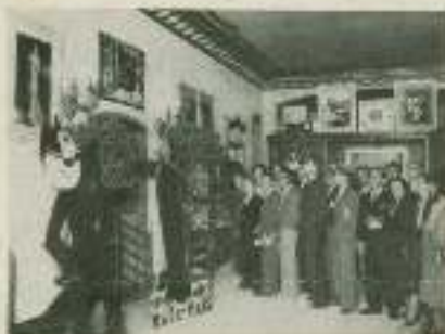
Desde primeras horas de la mañana el público visita el Museo Mata-Hari.

Uno de los medios de publicidad más eficaces utilizados por la «S. A. G. E.» para reclamar esta película ha consistido en un «Museo Mata-Hari», instalado en el lujoso vestíbulo del Palacio de la Música, en el cual ha reunido, aparte de una completa documentación fotográfica, inédita en España, numerosas joyas y objetos de auténtica pertenencia de la celebre espía. Todo ello, junto a una perfecta colección bibliográfica, en la que se resume todo cuanto hasta hoy se ha escrito sobre la vida de la célebre Mata-Hari, y una interesante colección de autógrafos de la famosa espía y de sus más conspicuos admiradores.