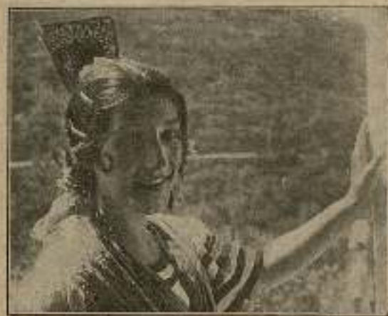
Dolorsiya, el más sabroso fruto del árbol genealógico...

A tiempo que el inquieto Cascales, oreado por las brisas mediterráneas, aguza el ingenio para alumbrar nuevas fuentes de regocijo, allá abajo