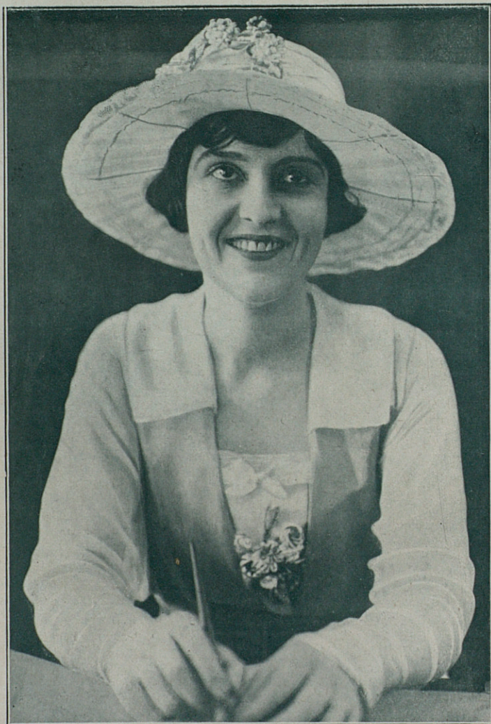
MADGE KENNEDY en «Lo más sublime»