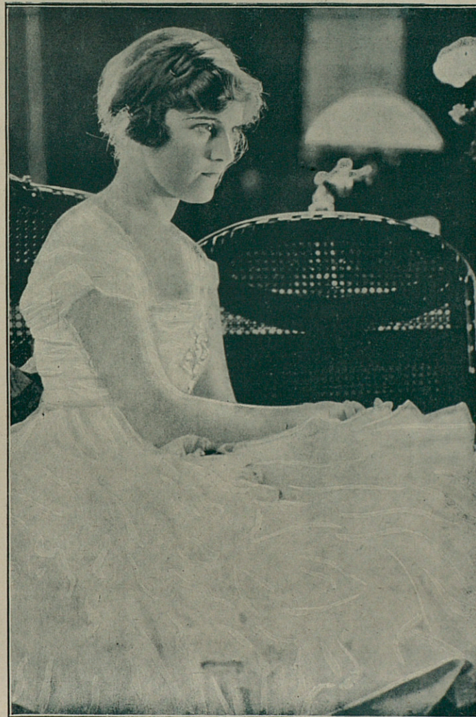
MADGE KENNEDY en «Los amores de Dodó»