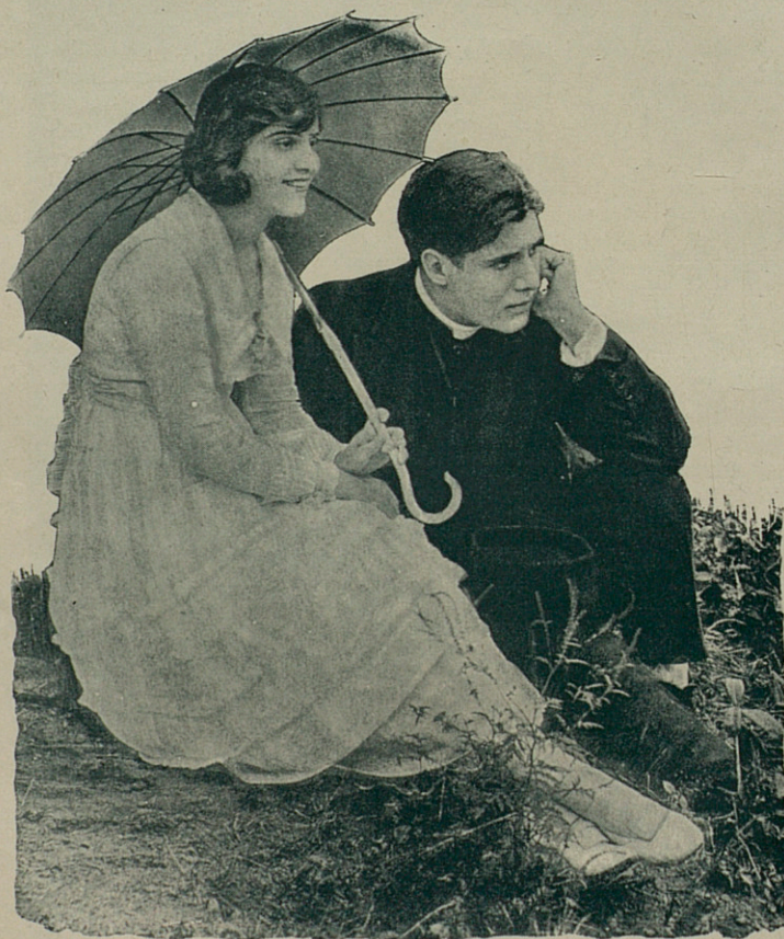
MADGE KENNEDY en « Toda una dama »

Esta historia de su matrimonio es una de las páginas más líricas, más sentimentales en la vida ejemplar de Madge Kennedy.