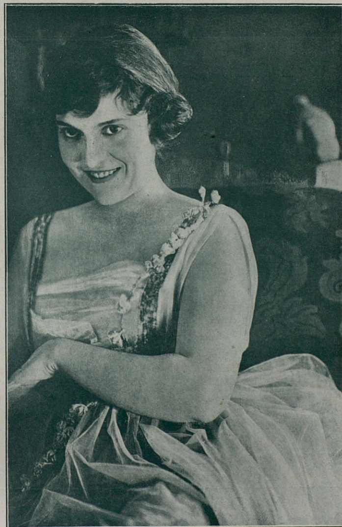
MADGE KENNEDY en «Jugar con fuego»