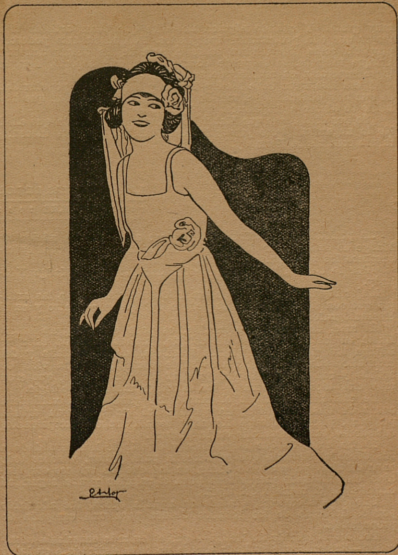
Madge Kennedy en Toda una dama

La escuchamos cuando estamos en el cine, hundidos en las tinieblas de la sala; la recordamos después en nuestras tristezas y en nuestras alegrías, como se recuerda una cosa que nos es