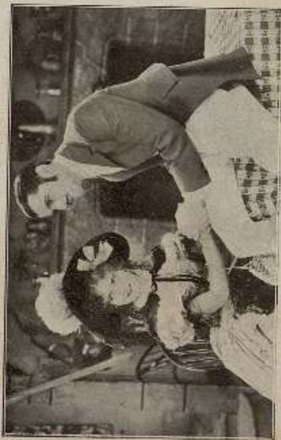
...y cautaron aquel dúo de amor...

mero es su carrera. Llama a Mágina y concédele lo que pide.