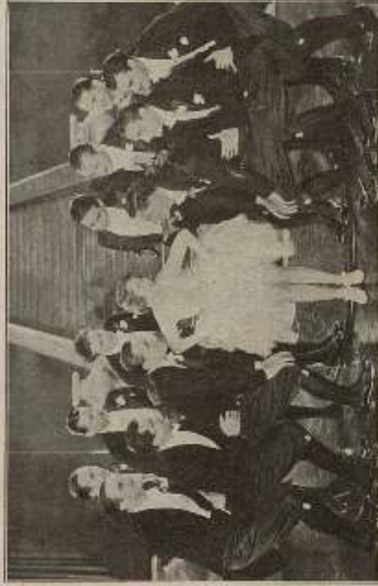
...una legión de caballeros que la rodearon con un gesto de adoración.