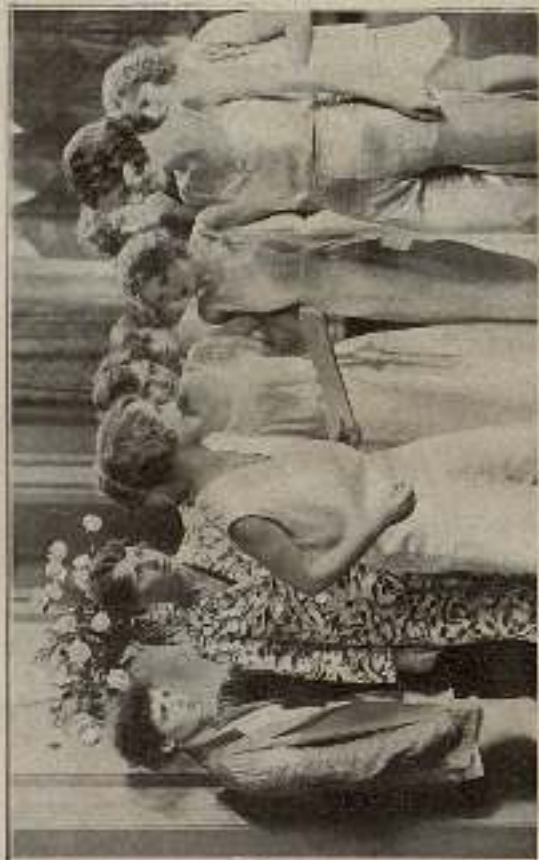
-¿Queréis que les dé una sorpresa a los muchachos?

Sólo dos espectadores demostraron su disgusto ante el anticipado éxito.