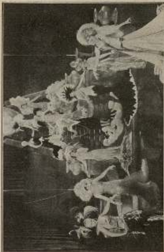
...comenzaron a descender muchachas vestidas con trajes vistosos y originalísimos.

—Tenemos que salvar a Mary a toda costa. Pri-