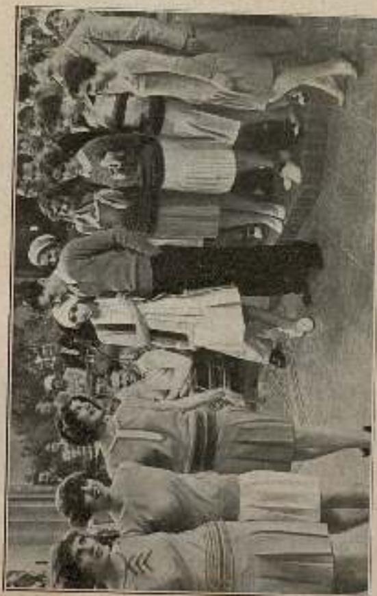
Las tres muchachas demostraron también que tenían un perfecto conocimiento del baile.

Las tres muchachas demostraron también que tenían un perfecto conocimiento del baile y el elemento masculino aplaudió aquel modo de levantar la pierna.