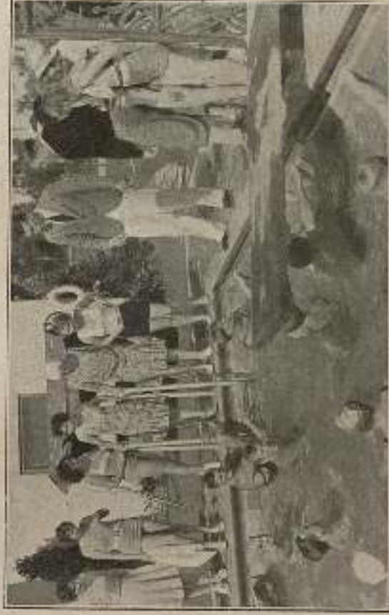
Daosé la mano, camarada...