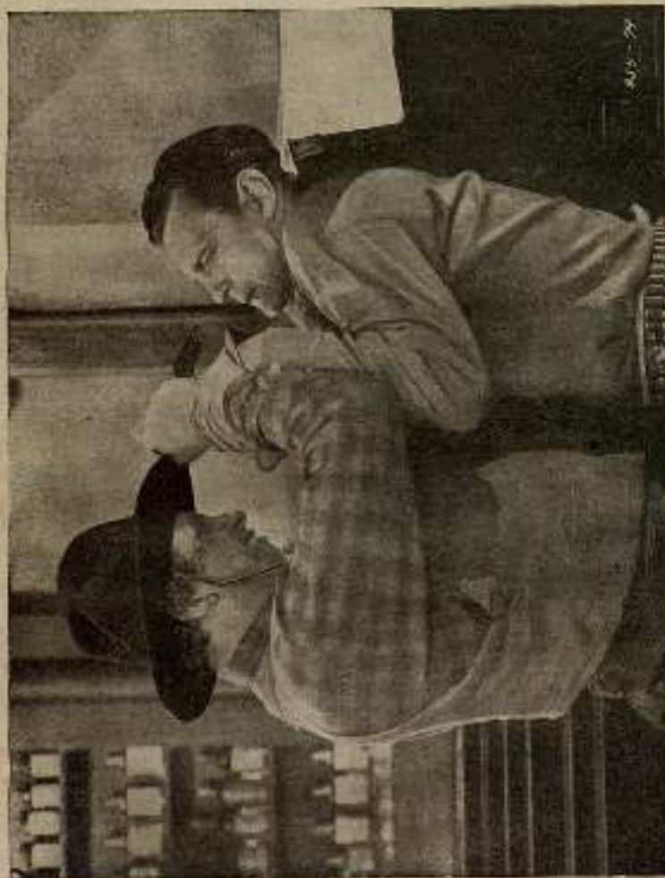
El temible bandido empujó el pedazo de botella rota que tenía el filo de un puñal...

la emoción y el coraje estas palabras que tanto tiempo había tenido que ahogar en su pecho: