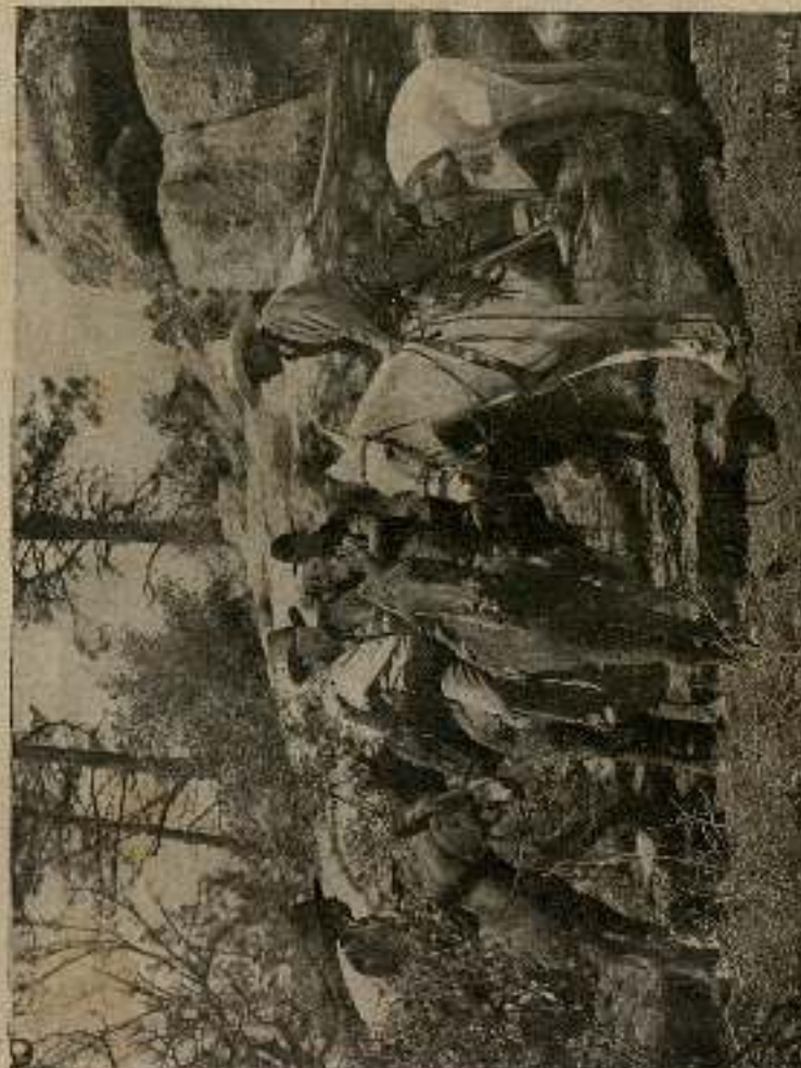
Con sus relucientes revólveres les invitaron a levantar los brazos en alto.

Después llevó a Conida a unos cuantos pasos de la entrada del cafetín y, anegándose con él, espetó con voz ronca por