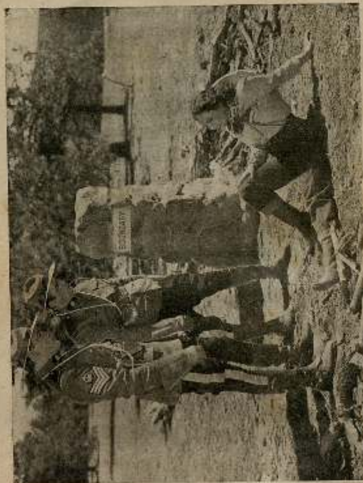
La jorcu sonrió con malicia al verse a dos pasos de los guardias...

Los caballos, espolcados constantemente por sus jinetes,