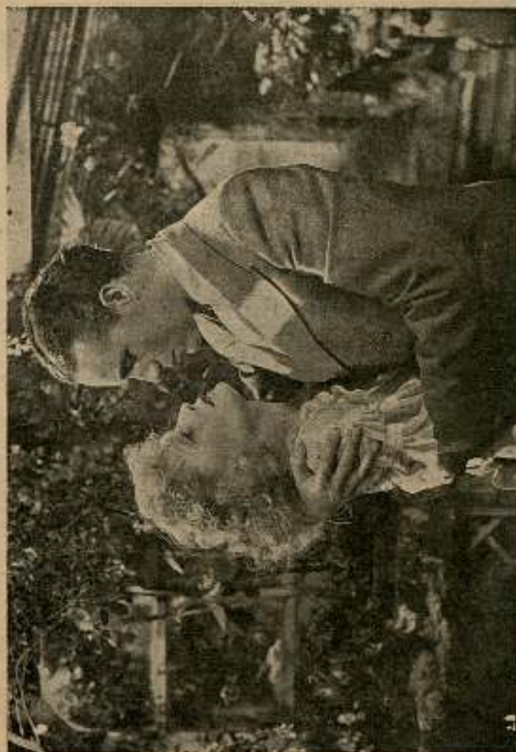
... la cogió en sus brazos y la besó...