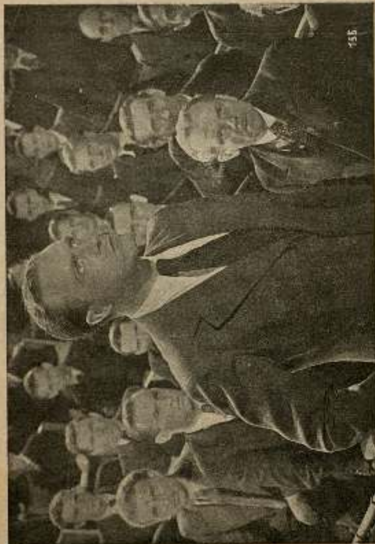
Príncipe Agaroff. Ha llegado el momento de que el pueblo finlandés hable cara a cara con su verdugo.

de esconder la carne dentro del farol para hacerla creer que se la había comido.