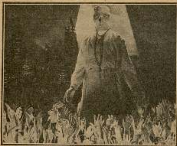
Creía ver miles de manos que se alzaban a él.