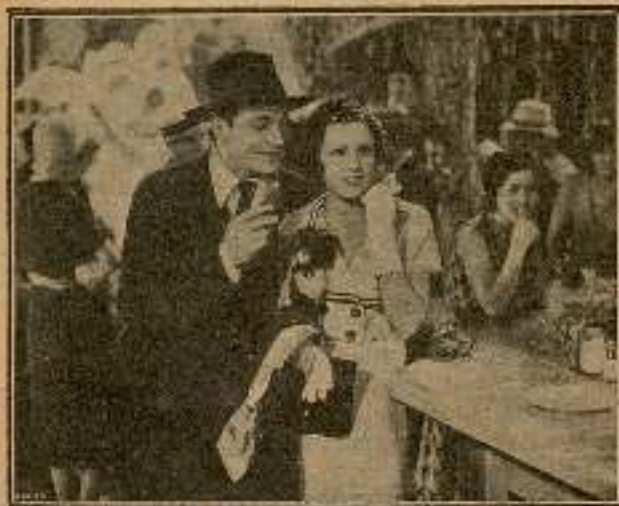
Todas las tardes los dos jóvenes salían a pasear.

—No soy ya un niño mamá... Tú siempre quieres tratarme como si tuviera nueve años.