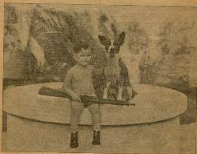
Tommy vio a Shirley

segundos le hacían aire con la toalla. Volvió en sí Bob y preguntó: