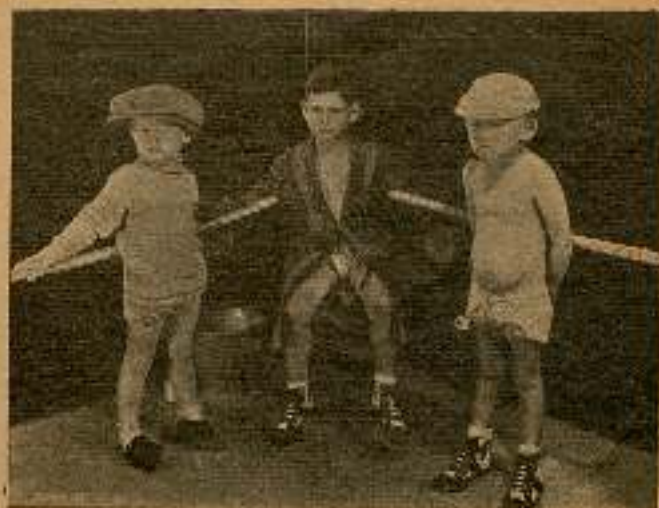
En su rincón le miraba furiosamente.

pañeros, los guantes que llevaba calzados "Vendaval" le parecían cinco veces más grandes que en realidad eran, incluso sentía deseos de marcharse, cosa que le dijo a su menager pero éste poniendo el grito en el cielo se lo impidió.