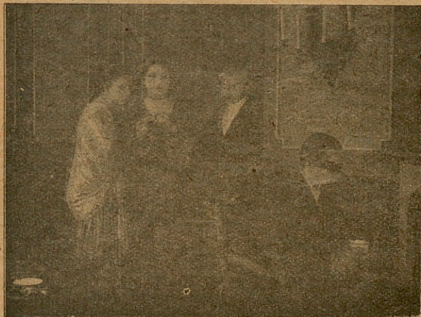
...y le comunicó la noticia.

Y se avanzó atrayéndola hacia sí. Eva se esquivó; mas al fin se dejó besar y se estremeció al contacto del ardor de aquellos