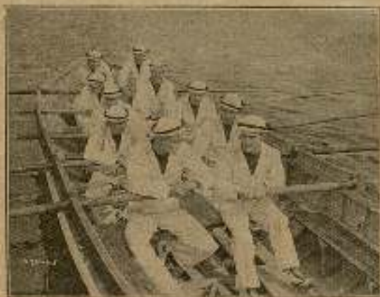
Una semana después, manejando sendos remos que por lo pesados se les antojaban postes de telégrafo...

sometidos los quintos eran más o menos pesados, pero la buena voluntad, y sobre todo la resignación, les ayudaban a seguir adelante sin desfallecer, o desfalleciendo lo menos posible.