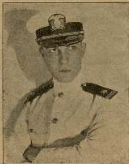
Dick, el bravo y apuesto alférez.

Dick, el bravo y apuesto alférez, buscó a Patricia, después de haber besado con idolatría a su buena madre que lloraba de felicidad; y contemplando a las parejas, dijo a su amada: