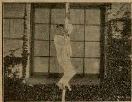
Y se deslizó por la cuerda formada de tal manera hasta el jardín.