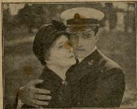
—Sí, madre... Sabré ser digno de ti.

La promesa hecha a su madre era sagrada para Dick. Mostróse digno del uniforme; y después de estudiar con tesón pasó a segundo año.