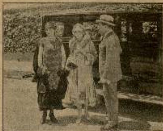
...se apearon dos bellísimas damas y un caballero.

Lawrence, al distinguir a los recién llegados, fué a su encuentro, y besó a la señorita que había llamado tan poderosamente la atención de Dick; y éste, al presenciar aquélla, creyó caerse de espaldas.