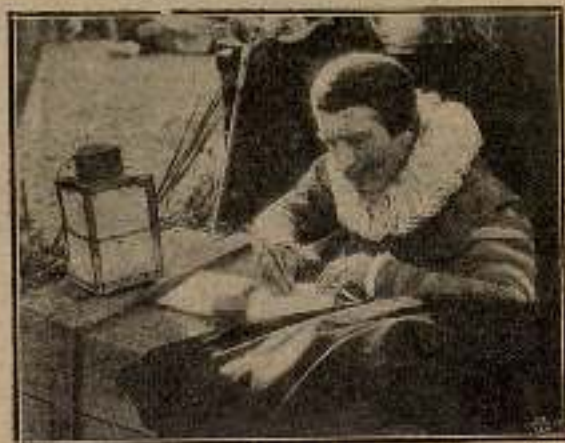
Bergerac escribe las cartas que diariamente, dos veces, envía a Roxana...

ladar al papel, que ella ha de leer y besar acaso, todos los ardores de su alma de poeta y enamorado. Ya que otra cosa nunca podrá conseguir, cuando menos hará que vibre el alma de Roxana con sus palabras.