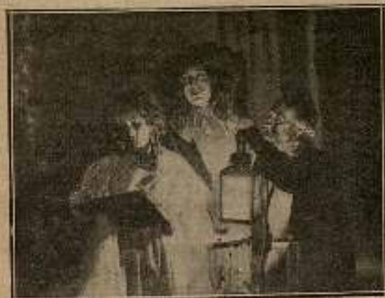
Brilló el gozo en los ojos del barón de Neuville, ...

los otros, defender el amor de Cristián, mientras él se consumía de pena. Sin embargo, el pensamiento de que con su sacrificio hacía feliz a Roxana daba tal consuelo a su alma,