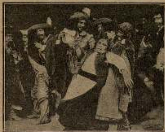
Asustados de la cólera de su amigo, todos retrocedieron...

que pasaba: pero Cyrano, al encontrarse delante de Cristian, hizo un esfuerzo sobre sí mismo y prosiguió, afectando sonreír: