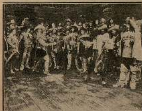
Acosado por Bergerac, Valvert había retrocedido...

«Falta un consonante en ero . Torpe al reñir como un niño y más blanco que el armiño, tú me lo das: majadero. Para este golpe certero. ¡Tente firme, Laridón! Cierro la línea. Atención. que al finalizar te hiero.»