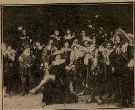
—Tenéis una... nariz... muy grande.

Cyrano se levantó, y entonces, Montfleury, entre una tempestad de risas y silbidos, desapareció, sin que fuerza humana pudiera contenerle.