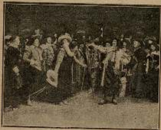
—¡Ah! Y yo, Cyrano Hércules y Saviniano de Bergerac.

—¿Qué ocurre?—preguntó el Vizconde, volviéndose rápidamente.