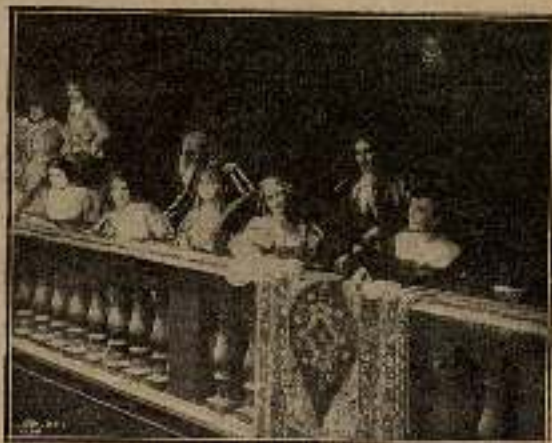
... Roxana, a la que de Guiche había conducido a uno de los palcos del primer piso.

sus amigos.—El de Guiche es poderoso y puede daros un disgusto en cuanto se entere de vuestra canción.