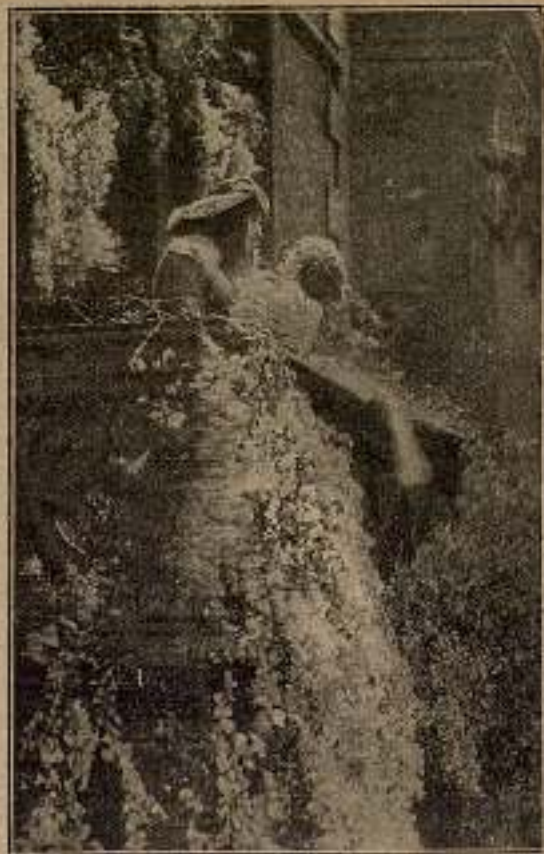
Y por las ramas y los pilares, Cristián se encaramó hasta el balcón.

Los dos amantes bajaron a la calle en el momento en que llegaba el capuchino.