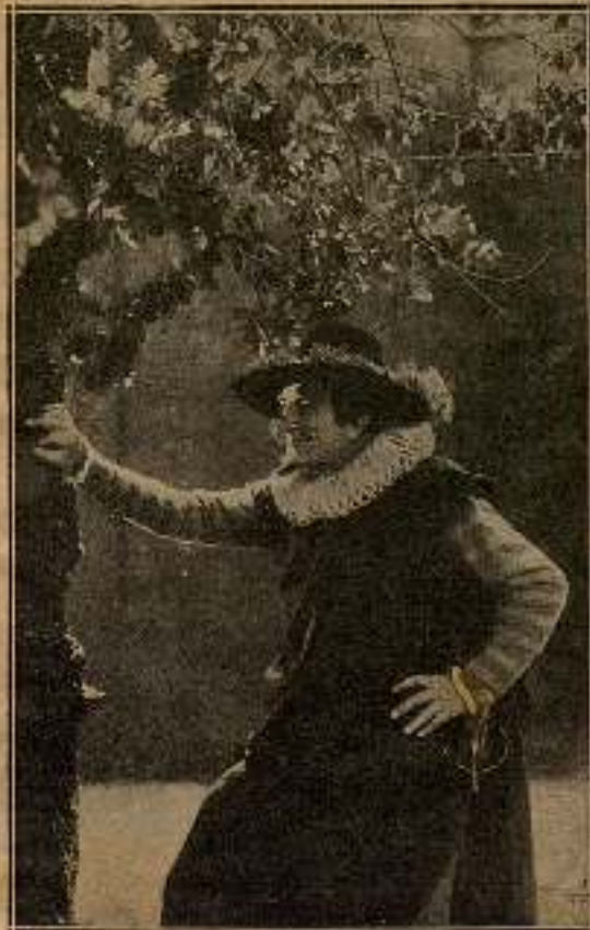
— Te dejo... Tú te bastas.

La turbación de Cristián iba en aumento.