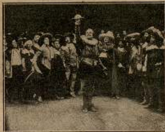
— «... ¡Y al finalizar te hiero!»

Un mosquetero corrió de pronto hacia el cadete.