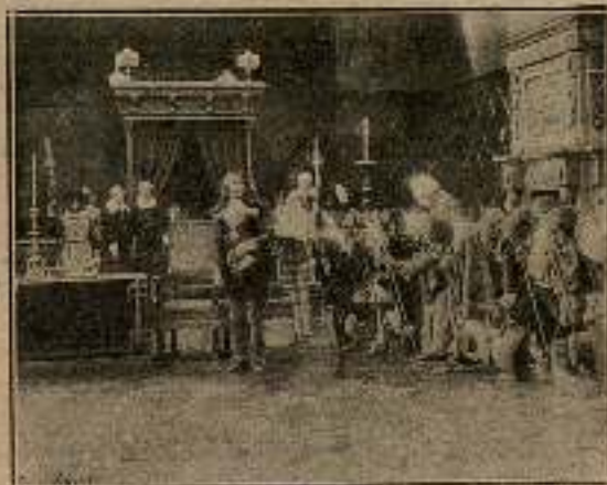
Una mañana, durante una recepción del rey Luis XIII, ...

El de Guiche destacóse del grupo de nobles que formaban la Corte del soberano.