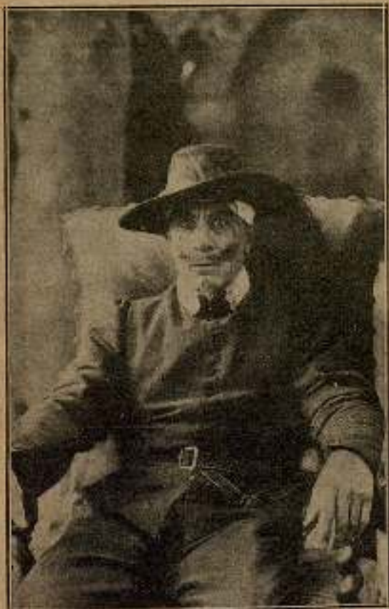
Cyrano sintióse morir. Sus ojos se enturbiaron...

Los acantos del órgano se hicieron más vivos, y la voz del templo llegó al parque acariciando al que agonizaba.