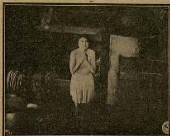
Estaba muy asustada...

un "skis" comenzó, a través de la abierta ventana, a limpiar la nieve, para dejar un boquete libre de salida.