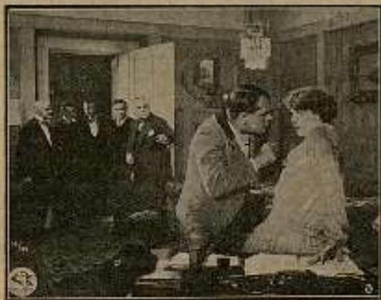
Avanzó hacia ella amenazador.

Acudieron el notario y los criados, quienes cogieron al guardabosque y lo echaron de la habitación.