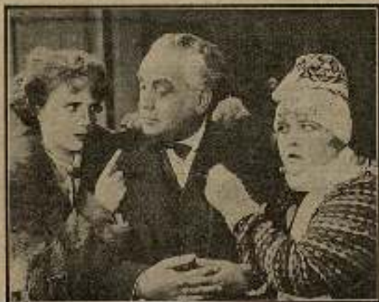
Las dos muchachas se defendieron bien.

—Pero, vamos por partes. ¿Quién es tu Adonis, hermana?