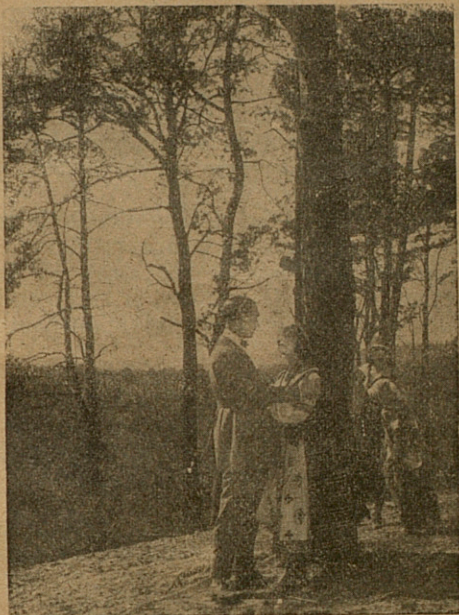
Esther albergaba en su alma una violenta pasión por el novio de su hermana

El joven no se da por vencido y procura ir reduciendo la resistencia de Lia desmenuzando sus argumentos y haciéndola que con sus ra-