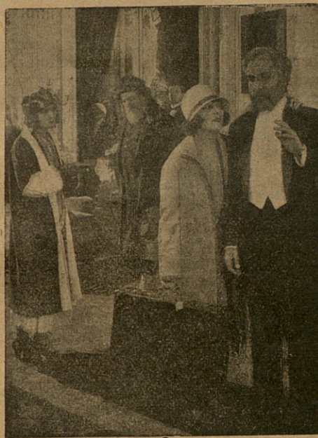
Lia sigue a su padre... (pág. 34)

obreros de Skaravaloff, la tierra que te vió nacer... Tiembla, Moisés, porque te veo rodeado de los que deberías despreciar, por ser