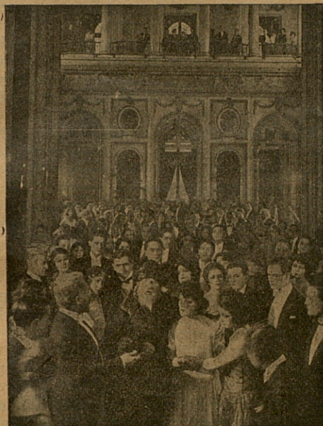
Tiembla Moisés si te enriqueces arruinando a tus hermanos (pág. 32)

Lia, comprendiendo el alcance de las pala-