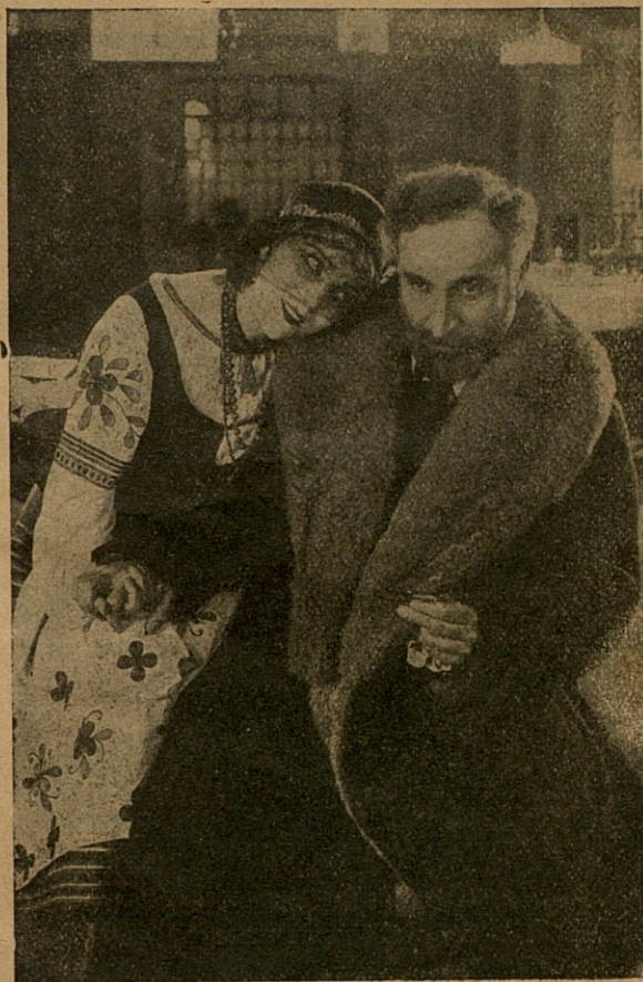
El que me ayude a socorrer a los humildes será mi esposo (pág. 54)

Y así apoyándose en los sagrados textos de la Historia, procura llevar al ánimo de Lia, la convicción de que debe aceptar por esposo a su hermano Moisés.