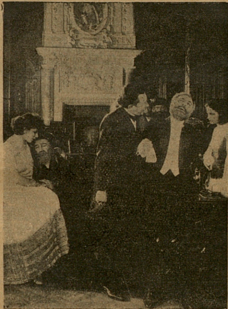
...fastuoso ambiente que rodea a Moisés (pág. 18)