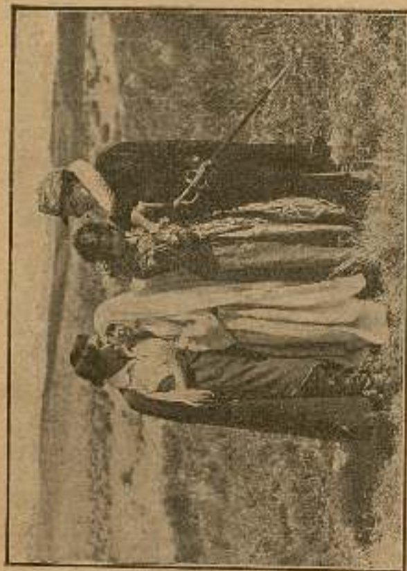
Lascruces y Durán con sus amantes.

En un lugar de la Mancha, de cuyo nombre quiero acordarme, vivía un hidalgo de los de lanza en astillero, adarga antigua, rocín flaco y galgo corredor. Tenía en su casa un ama que pasaba de los cuarenta y una sobrina próxima a cumplir los veinte. Frisaba la edad de nuestro hidalgo con los cincuenta años, gran madrugador y amigo de la caza.