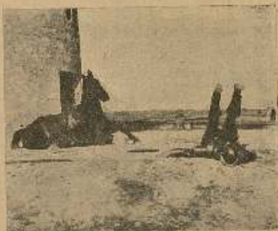
...y dió con su cuerpo y el de Rocinante en tierra.

de honrarle y honrarle con prendas mías; pero siendo tu padre vivo, a él le toca de justo derecho la demanda, que no es Lucinda para tomarse ni darse a hurto.