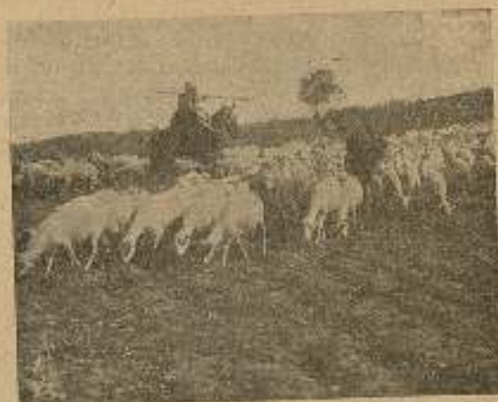
Este cardenio, se entró por medio...

—El miedo que tienes—dijo Don Quijote—te impide que ni veas ni oigas a derechas, porque uno de los defectos del miedo es el