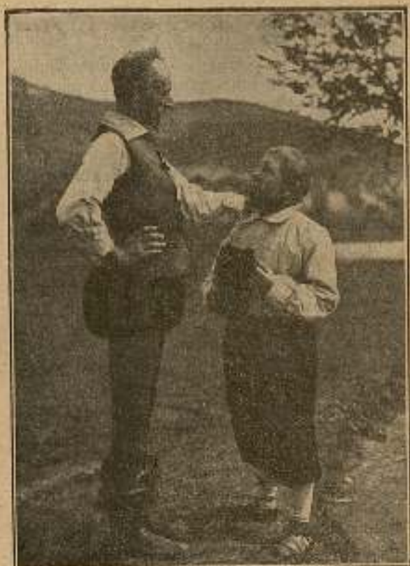
— Ya sabes Sancho —

No quiso contradecirle el ama y algunos días después solicitó Don Quijote a un labrador vecino suyo para que le sirviera de lacayo. Tanto le dijo, tanto le prometió y le persuadió, que terminó él, infeliz villano, por