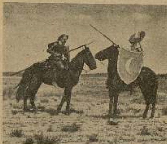
Presle a frente del caballero de la Blanca Luna.

—Yo soy, le dijo, el más famoso caballero del orbe, vengo a contender contigo y