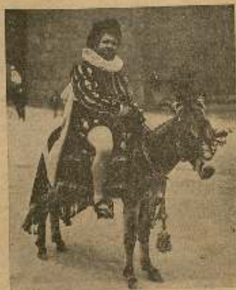
Al día siguiente...

—En cuanto a honradez, señora, yo os aseguro que no tiene igual—terció Don Quijote.