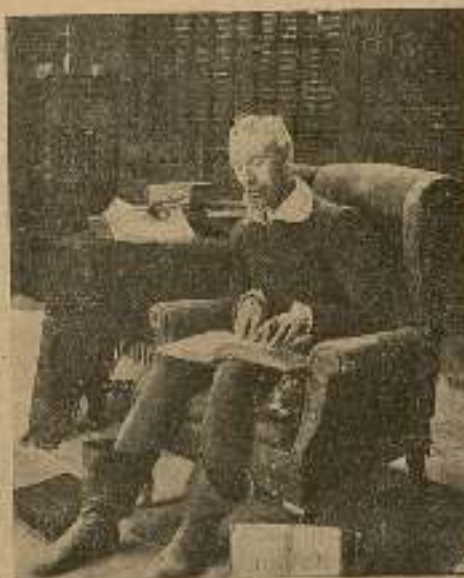
Los ratos que estaba ocioso...

Imaginábase el pobre ya coronado, y así, con estos tan agradables pesamientos, lo