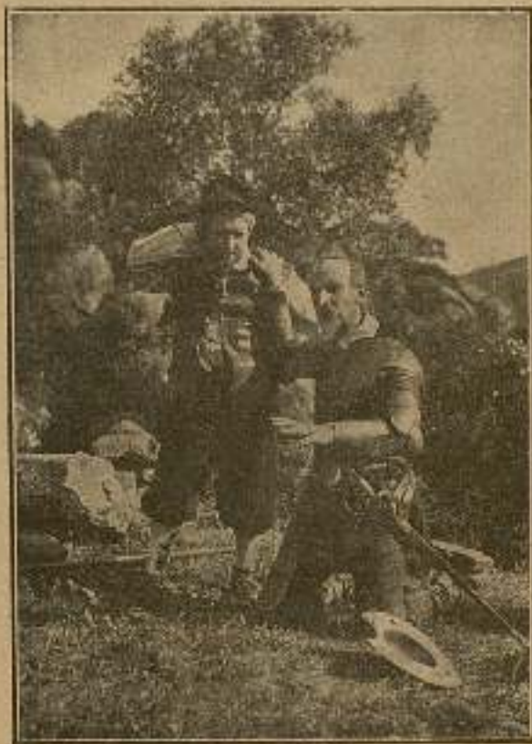
—Acude, Sancho, y mira lo que has de ver y no has de creer.