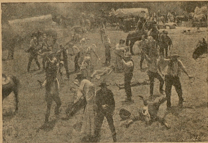
Los blancos habían ido ganando terreno...

Cundía por todo el país la llamarada de odio que prendía como pólvora seca, y en tanto, dos aventureros blancos, jóvenes, valientes, llenos de optimismo y desprecio a la vida, se disponían a continuar el camino no