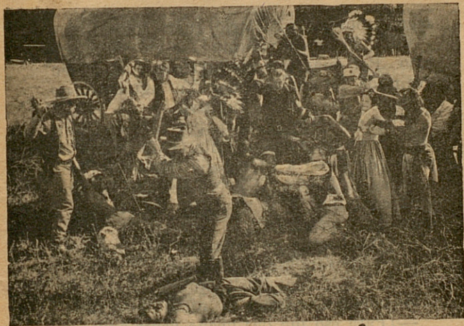
...los individuos sobornados de Carter raptaron a la muchacha.

No había terminado de pronunciar estas palabras, cuando Manning se arrojó sobre él asestándole un fuerte golpe en la cara. Defendióse el malvado como pudo, pero Jack era más fuerte y en tanto que el bravo Bill y sus amigos se las entendían con los de Carter, Jack arrebató a viva fuerza la bolsa que Woods reconoció en seguida. Afortunadamente, había todo el oro.