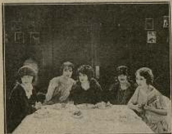
...Hoy mismo me he acompañado en la mesa del restaurant "El Film", Marjorie Daw y Bessie Love.

Y le lee el escrito que había de la supuesta comida con las artistas.