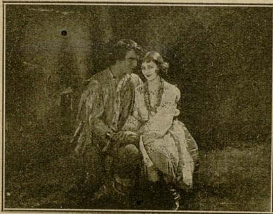
¡Un rey de leyenda!