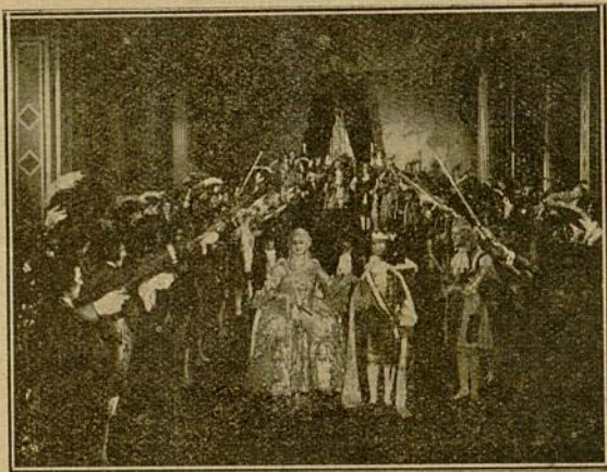
El rey presentó a la Corte a la bella princesa...

El rey presentó a la Corte a la bella princesa, y al llegar a la altura de un arrogante oficial, dijo Blanca, mirando a éste con inmenso amor: