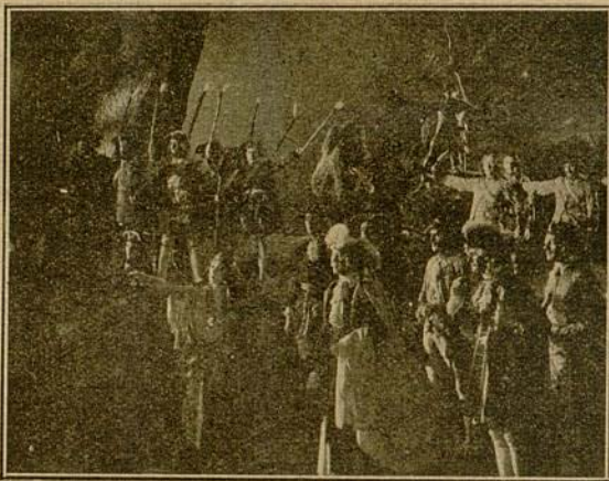
Se organizaron los trabajos de salvamento...

El rey y Blanca se hallaban ya en la margen del río donde se hallaba el tesoro. Se organizaron los trabajos de salvamento del tesoro, y, al poco, éstos se vieron coronados por el éxito, pues el cofre con las joyas de Omar apareció.