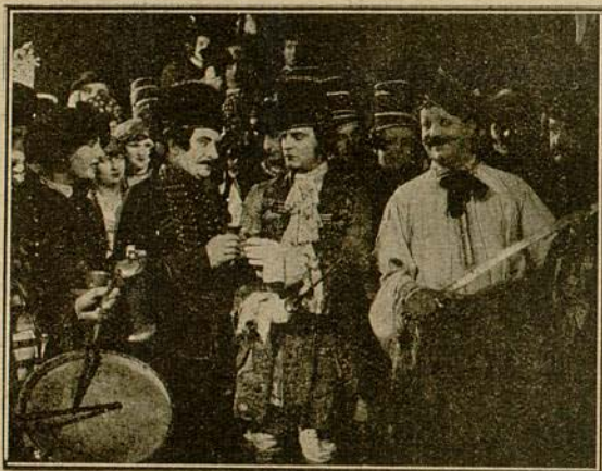
En cambio, el barón estaba triste...

De pronto, Blanca, que había tenido que ir al