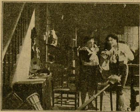
A la sazón rapaba barbas en Sevilla.

médicos, el establecimiento de Fígaro tenía, aparte los útiles del barbero, tales como bacías y navajas, las tenazas del dentista y todos los instrumentos científicos que se necesitaban para hacer sangrías, aplicar cataplasmas y demás re-