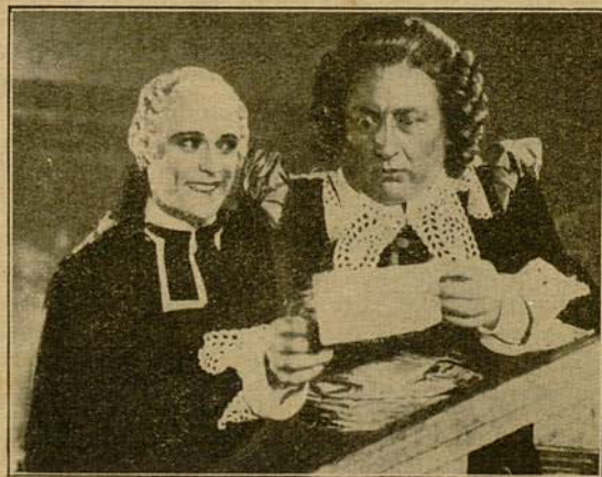
Don Bartolo se mostró impresionado al leerlo.

Entonces sí que no hubo disculpa para el traidor, el cual hubo de tomar las de Villadiego, perseguido por el furibundo don Bartolo.