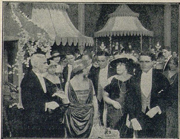
Una escena de la interesante película cómica dramática «Vida de artista», exclusiva de Radium films y que se pasará el 16 de Enero próximo