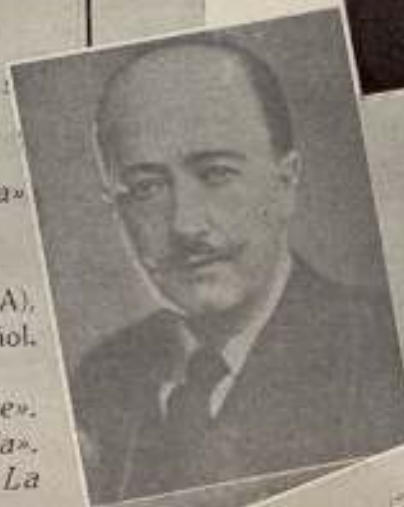
Manuel de Góngora

En el teatro Español de Madrid, tuvo lugar el día 8 de mayo el reparto de premios concedidos por el Sindicato Nacional del Espectáculo, en virtud de la institución de su concurso anual para conceder premios al teatro, cinematografía y música.