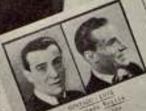
ANTONIO LUIS SANTOS ELIAS DE OLIVERA FRANCISCO FERRER RODRIGUEZ Y LOPE "EL CLÁSICO DE LA VIGILANCIA" MIGUEL

La primera película policíaca española, que sorprende a todos por su originalidad, ritmo y emoción.