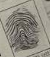
RAFAEL S. DEL CASTILLO "MONTAÑAS Y VALLES" "EL CLÁSICO DE LA VIGILANCIA" FERRER