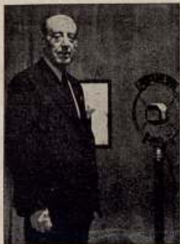
Nuestro actor don Pablo Hidalgo ante el micrófono de E. A. Q. hablando al público de América.