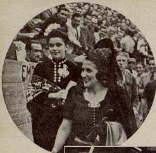
Estrellita Castro y Ana Mariscal asisten también a las corridas de toros.