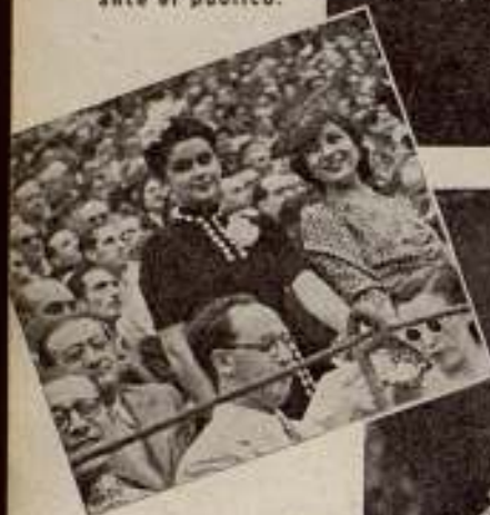
Conchita Piquer y Ana Mariscal en su barrera de los toros.