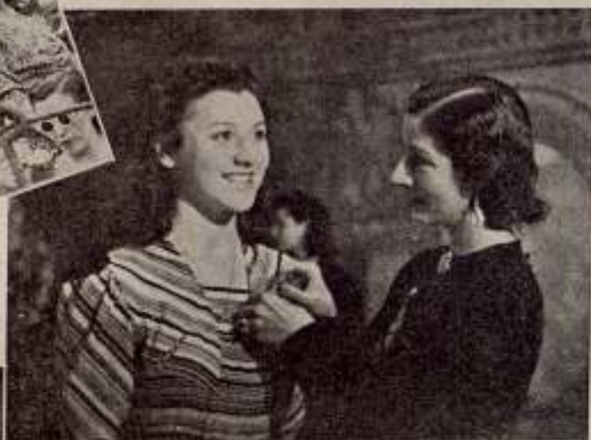
Conchita Piquer imponiendo el distintivo a una de las seleccionadas.