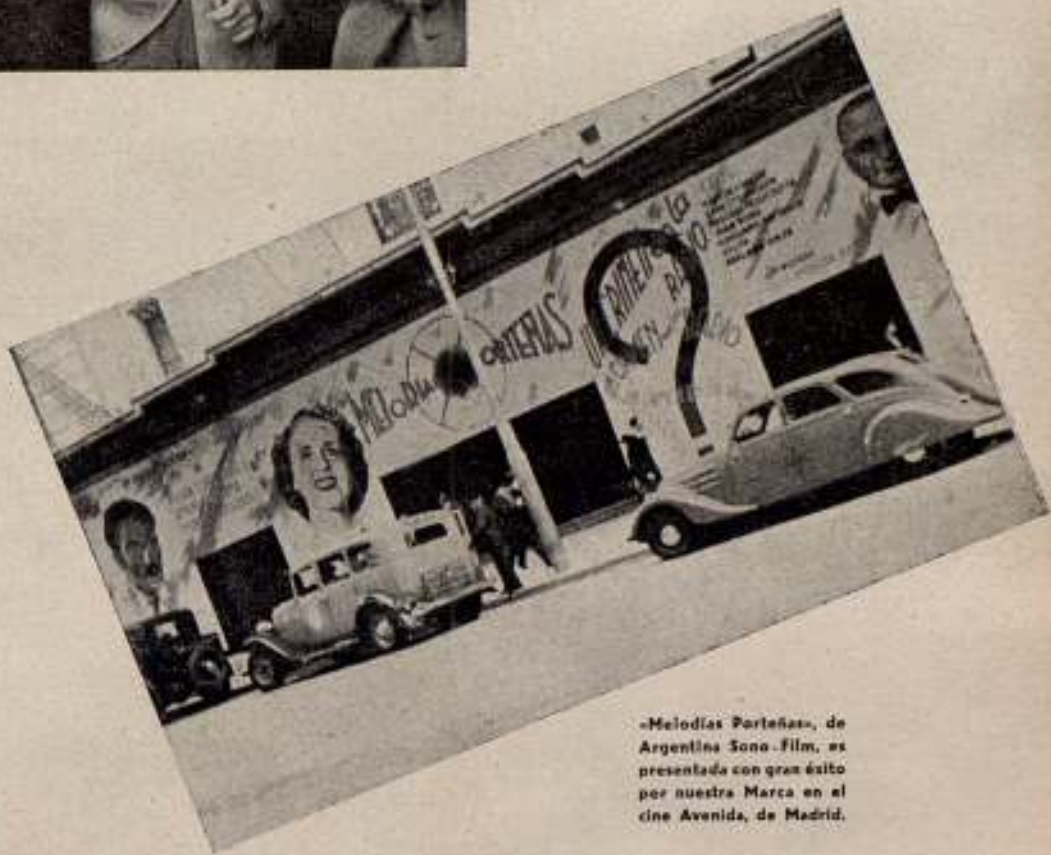
«Melodías Portueñas», de Argentina Sono-Film, es presentada con gran éxito por nuestra Marca en el cine Avenida, de Madrid.