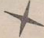
de los Viveros, presencié las pruebas