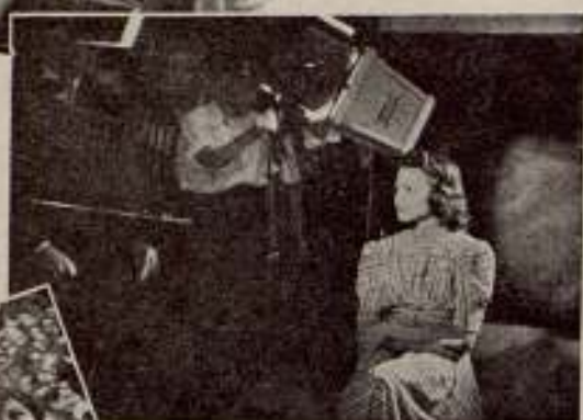
Una concursante «sufriendo» la prueba ante el público.