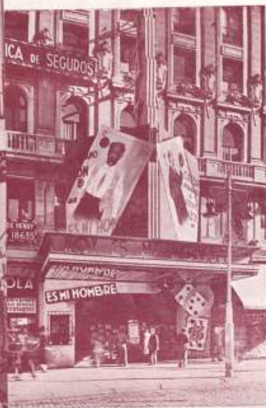
FACIADA DEL «RIALTO»