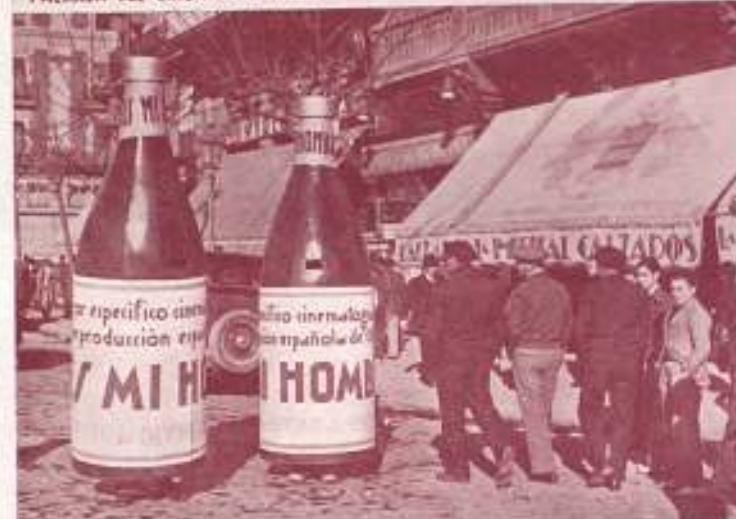
«ES MI HOMBRE»