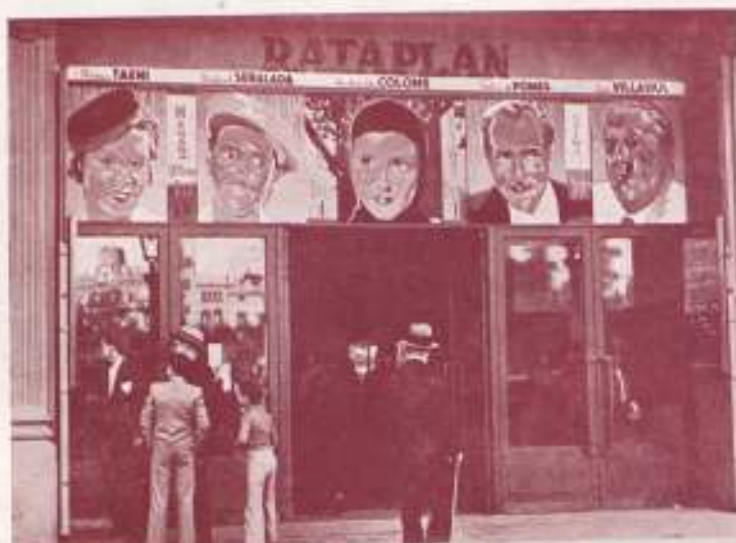
FACIADA DEL CINEMA CATALUÑA

Facetas de la publicidad urbana de nuestras películas «Rataplan», «Es mi hombre» y «Nobleza baturra» en Barcelona, Valencia, Las Palmas, Palma de Mallorca y Madrid.