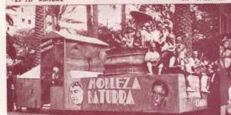
CARROZA DEL «HOLLYWOOD» CINEMA