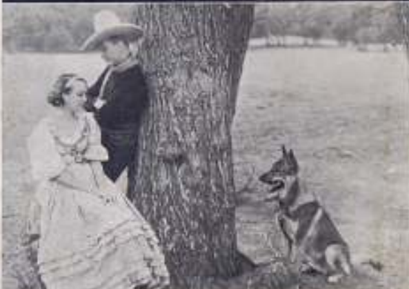
UN BANDIDO LEAL