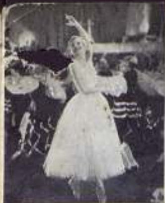
Lilian Harvey en su nuevo «film» de la B. I. P. «Invitación al vals», en la que hace su mayor creación.