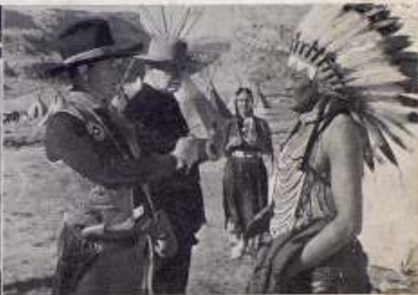
JUSTICIA PARA EL INDIJO