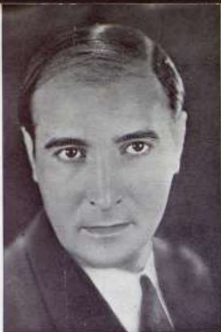
Florian Rey, director.

La realización sonora de «Nobleza baturra» nadie mejor que Florian Rey para llevarla a la pantalla. Aragonés por los cuatro costados, prestigio cinematográfico de primera categoría entre lo nacional y conocedor como pocos de los más difíciles secretos y resortes que mueven la pantalla, Florian Rey ha pasado unos días por tierras aragonesas eligiendo ambientes, tipos y aquellas costumbres más genuinamente aragonesas, regresando entusiasmado de esta excursión. De protagonistas poco diremos, aunque sí sea esto lo mejor. Imperio Argentina, la que ayer encarnara