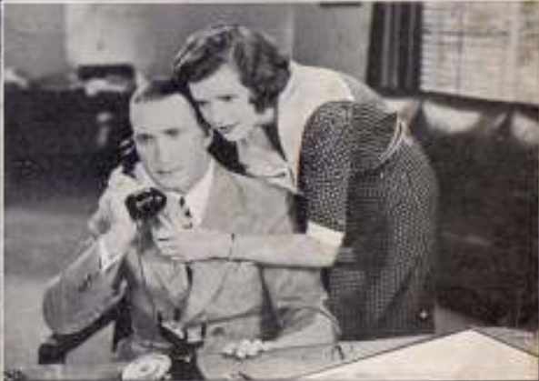
UNA VOZ EN LA NOCHE

Fotogramas de algunas de las películas de Tim Mc. Coy, realizadas bajo la marca Columbia.