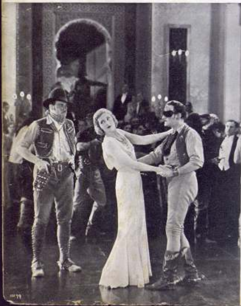
La disputa de un amor entre dos rivales.

Baltasar escapa, pero no va solo. Consigo lleva la hija del gobernador saliente, y juntamente marchan también el reconstruido matrimonio de su ayudante y esposa, y solamente queda sin pareja la figura gigantesca del que fue gobernador, que se consuela de su perdida esposa tocando la ocarina.