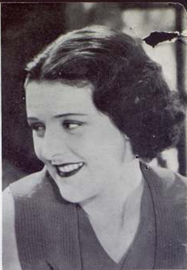
Imperio Argentina, protagonista.

insuperablemente el alma de Andalucía en «La Hermana San Sulpicio», va a protagonizar el principal rol de esta obra encarnación vigorosa del alma aragonesa. Imperio hará de este film otro triunfo más para la cinematografía nacional y para Cifesa. A Imperio Argentina la segunda Ligeró. El cómico más selecto que conoce la pantalla española y de más dúctil sensibilidad artística, «Nobleza baturra» no dudamos en afirmar será la continuación superada de los éxitos logrados por «La Hermana San Sulpicio».