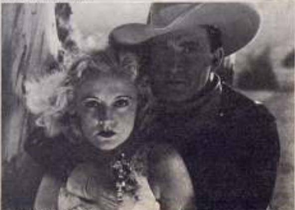
EL BICO DEL PUNTO

Fotogramas de algunas de las películas de Tim Mc. Coy, realizadas bajo la marca Columbia.