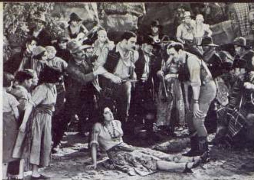
Una singular escena de este film pintoresco y divertido.