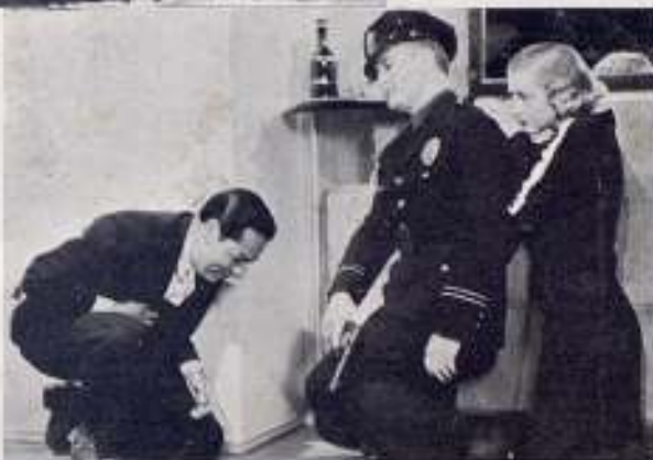
LA VOZ DEL PELIGRO

El artista múltiple y vario, fácil en sus interpretaciones y diferente en todas. Tras la mirada fija y optimista de sus ojos claros centellea, siempre, la flama del hombre dinámico, del actor que vive con toda propiedad la acción del cine moderno.