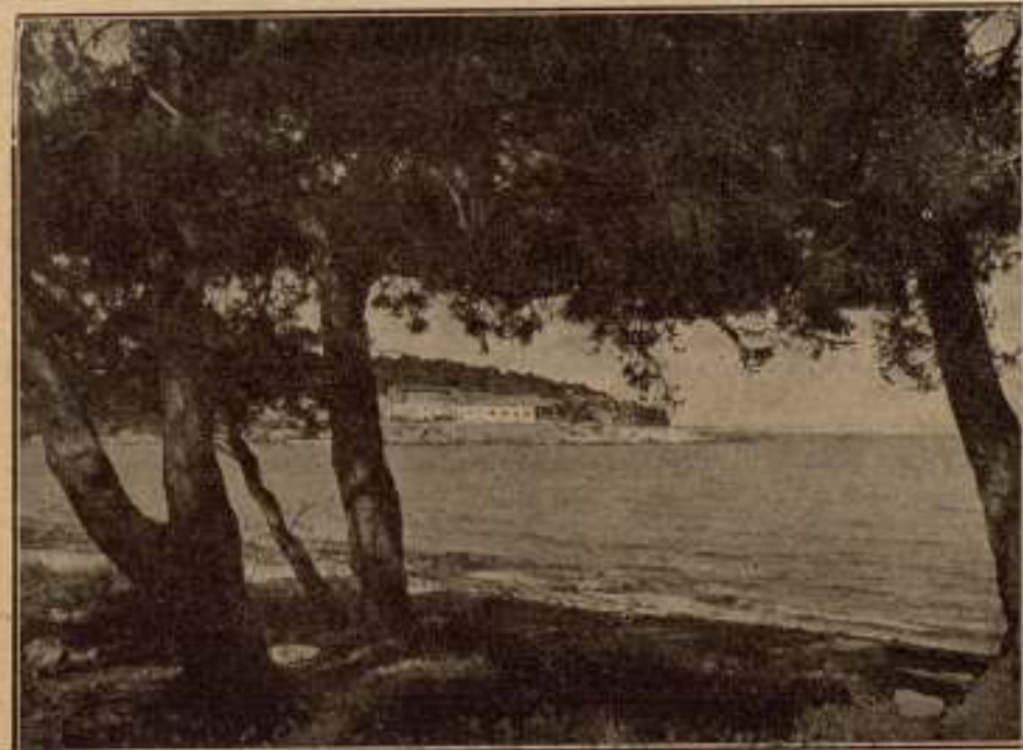
Vista panorámica de la nueva urbanización PALMA-NOVA.

Modernísima urbanización en el lugar más bello de la isla de Oro - PALMA-NOVA (a 14 kms. de Palma de Mallorca) - Vendemos en esta maravillosa urbanización de PALMA-NOVA solares idénticos para edificar «villas» y chalets. También nos encargamos de su construcción. Tenemos ya otros edificios para la entrega inmediata - PALMA-NOVA reúne todas las condiciones deseables. Apacible quietud, jardines, bosques de pinos seculares. Atmósfera diáfana y luz la más bella del orbe. Agua potable riquísima, electricidad, carreteras asfaltadas, etc. Campos de tenis. Puerto natural para los deportes de mar.