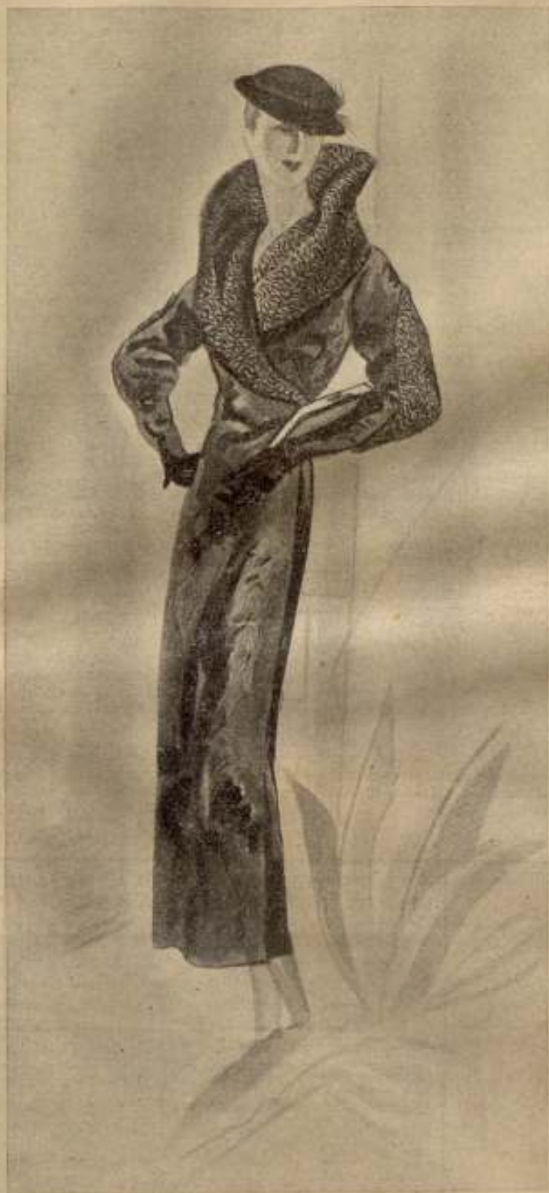
Modelo de la casa Simon Frères, de París, en patró negro con cuello y codos de astracán del mismo color. Creaciones de la que es concesionaria la Peletería de París, S. A., Puertaerrisa, 7 y 9.