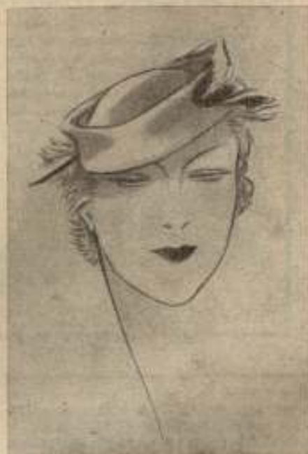
Toca en fieltro «chiné» gris, con «couteau» de águila real. (De la colección Modas Carmen)

IMPERMEABLES PARA SEÑORA Y CABALLERO GABANES DE PIEL Y DE CUERO CHAQUETAS SPORT SWETERS Y CHAQUETAS DE PIEL LOS MÁS ELEGANTES MODELOS PRECIOS REDUCIDOS