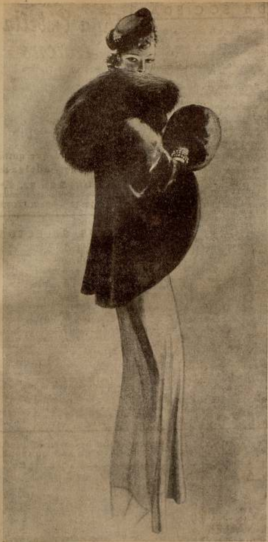
Modelo de la casa Simon, Frères, de París, de cuyas creaciones es concesionaria en Barcelona la Peletería de París, S. A., con domicilio en Puertaferrisa, 7 y 9.