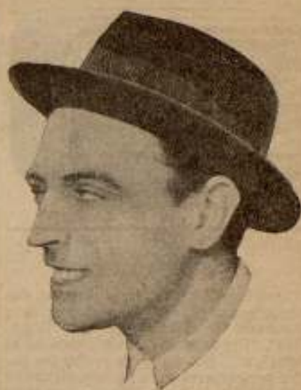
Tony d'Algy, uno de los más destacados actores de la pantalla española

Vino inmediatamente la lógica reacción y, mientras los pueblos que gozaban la hegemonía cinematográfica se veían asaltados por severas complicaciones, España inició su camino. Hemos dicho ya que estamos próximos a ver convertido el cine de casa en una actividad industrial formidable. Y lo que en las horas iniciales nos movía a silenciar equivocaciones debe ya truncarse, por un legítimo interés, en cuidar nuestros asuntos y nuestro buen gusto en la producción, pues, próximos quizá a abarcar aquella exportación soñada, si no velamos por esta depuración vamos a comprometer el buen nom-