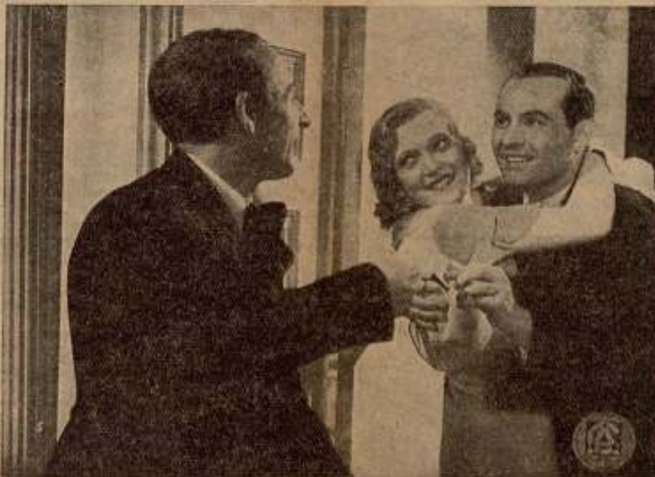
Martha Eggerth y Jan Kiepura en una escena de «Paso a la Juventud»

PRÓXIMAMENTE DAREMOS A CONOCER LA LISTA DE PREMIOS Y REGLAMENTO DEL CONCURSO