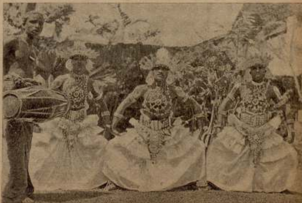
De nuestras documentales: Ceilán