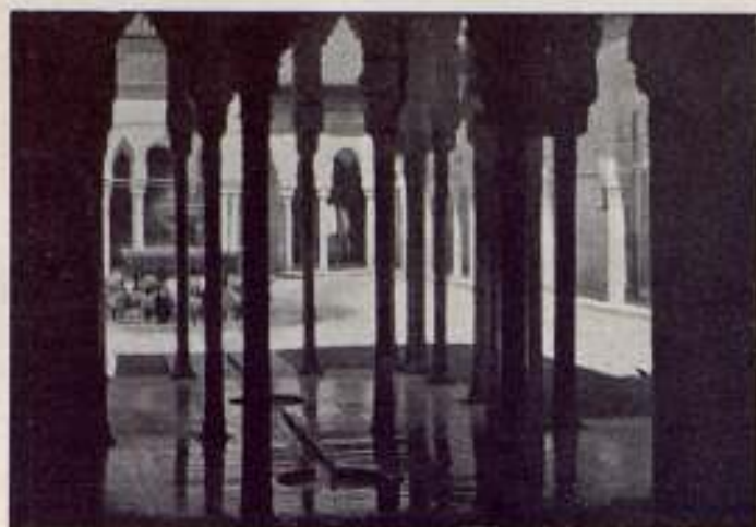
FOTOGRAMA DEL INTERESANTE DOCUMENTAL DE LA ALHAMBRA AL ALBAICÍN