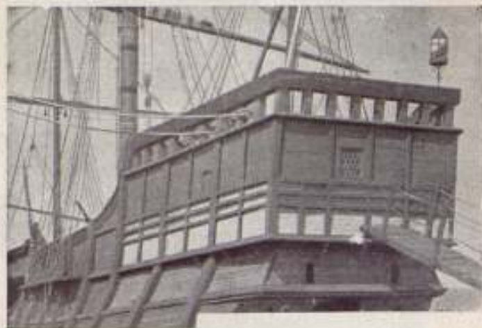
UNA ESCENA DEL ORIGINAL REPORTAJE AL BORDE DEL GRAN VIAJE