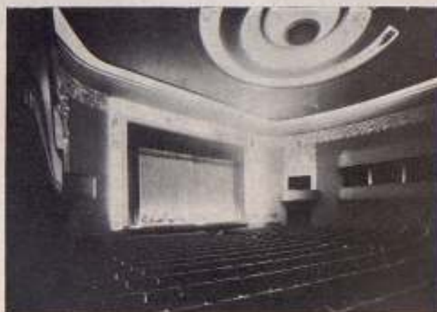
Cine Goya de la Empresa Parra, S. L. de Zaragoza

La cordial acogida que en todo momento nos ha dispensado la "Empresa Parra" nos obligan a multiplicar nuestros esfuerzos para acrecentar aún más los brillantes resultados logrados con una compenetración altamente laudable.