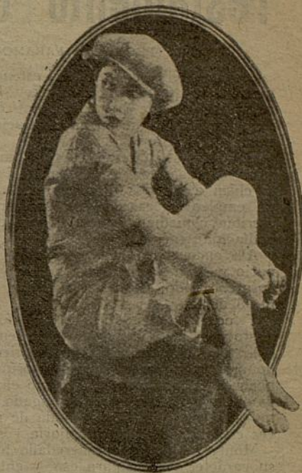
Bessie Love tiene un precioso cuerpo, menudo y gracioso.

Su cuerpo, menudo y bien hecho, parece el de un golfillo vendedor de periódicos, y no obstante es esa linda Bessie Love,