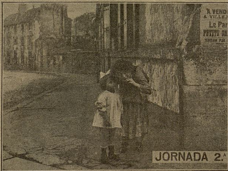
Una escena de la película «La taberna»

EL MANUAL EL ARTISTA CINEMATOGRAFICO vale 2 pesetas en la Escuela Nacional de Arte Cinematográfico, calle San Pablo, núm. 10, Barcelona. Preparación de artistas para España y extranjero. Edición de películas