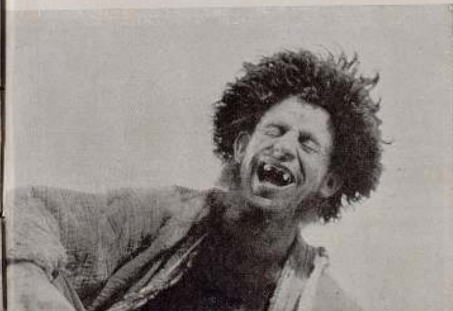
«La tierra tiene sed», film soviético de Ermolinsky y Raisman.