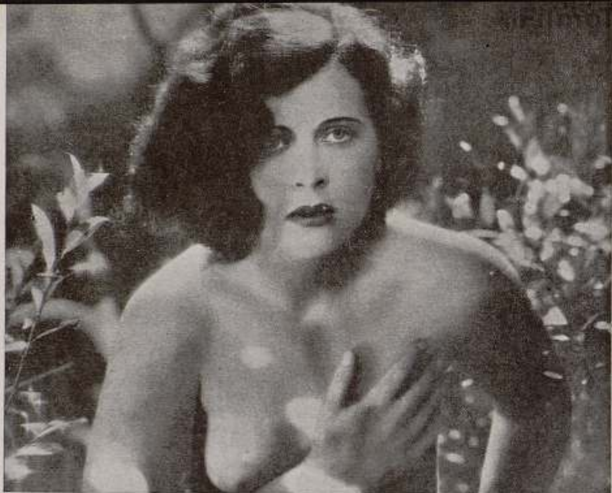
«Éxtasis», film checo de Gustavo Majeti del que hablaremos en nuestro próximo cuaderno.

ducir fuera de Alemania sin la debida autorización, se exponen a ver prohibidos sus films en todo el territorio germano.