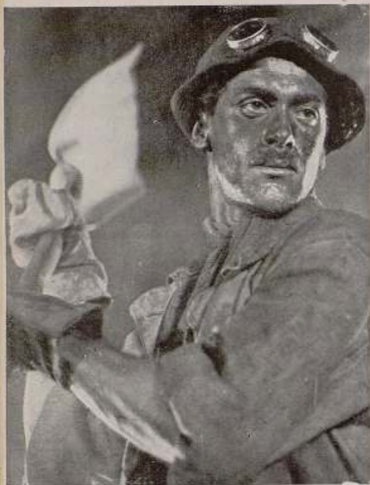
El Obrero Joven de «Montañas de Oro».

Joven Obrero: ¡Vassily, he aquí a Pedro! Pedro te trae noticias de tu casa. Y bien, ¿qué es lo que te ha dado Dios?