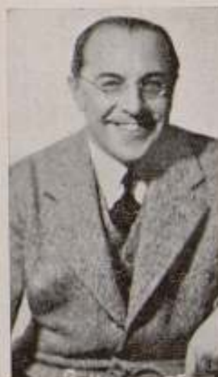
He aquí una expresión optimista de G. W. Pabst al recibir la «Legión de Honor» con que le ha condecorado el Gobierno francés. En nuestro próximo número hablaremos extensamente de su último film «Don Quijote de la Mancha».

zada por NUESTRO CINEMA. Es más: hemos visto que en su torno se alza el mismo silencio e indiferencia, por parte de toda la Prensa más o menos gubernamental, con que se acogió la aparición de nuestra revista en esos medios.