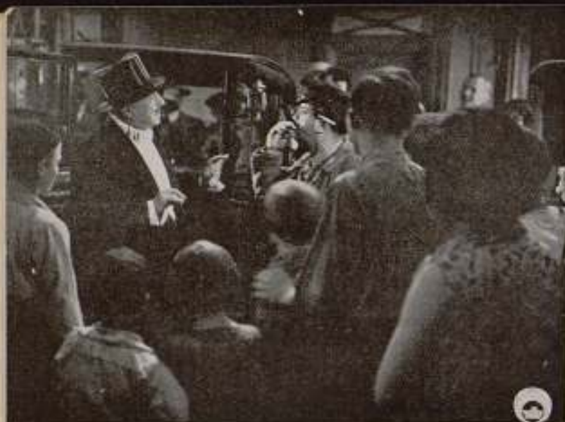
«14 de julio», de René Clair.

Moscú y de Leningrado piensan en los hombres de Turkmenia. Desde las ventanillas de un tren, una brigada de jóvenes técnicos soviéticos lanzan el coro de sus canciones revolucionarias. Más tarde les veremos arribar al poblado, en donde la gente muere de sed, llenos de polvo y de fe en sí mismos. Las masas se mueven como electrificadas. Uno tras otro, los técnicos soviéticos lanzan su consigna: ¡El agua y la tierra nos pertenece! ¡Nosotros saltaremos con dinamita los montes «sagrados» y cambiaremos el cauce del río para que el agua se precipite sobre nuestros pueblos...!