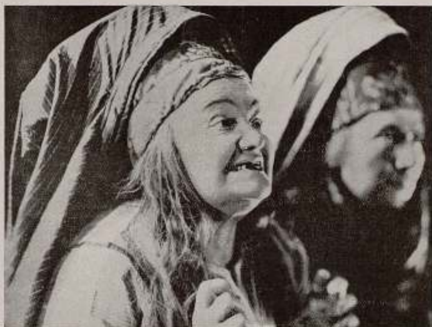
«Aina», film soviético de Tichonoff.

cando en lo manido, para hallar el material de su obra. Le ha bastado con recoger, con la penetración de una sensibilidad al servicio de lo nuevo, e intercalarla con la belleza de unas imágenes felices, todas las ansias, las vicisitudes de su clase, en determinado momento de la Historia. De la cantera inextinguible de la revolución, Arconada ha extraído su material y ha creado, con la ayuda decisiva de su talento, una magnífica muestra de la capacidad artística del proletariado.