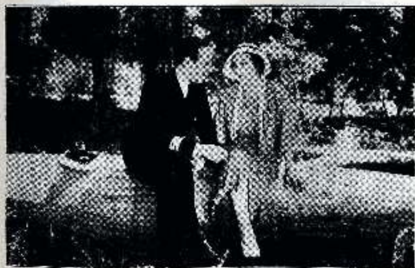
—... Todas las esperanzas de mi vida van a realizarse ya...