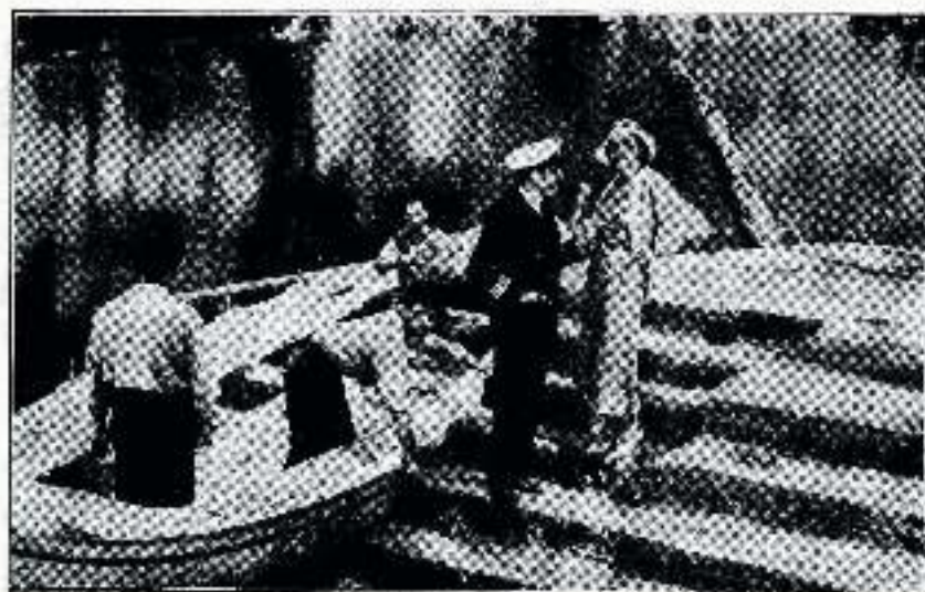
—Muy agradable. No te esperaba hoy.