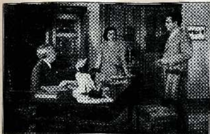
— Al señor ya lo conoces de ayer...

muchacho de unos veinte años, simpático y jovial.