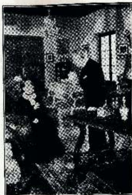
Siempre se ha dejado en demasiada libertad a Ortavia.