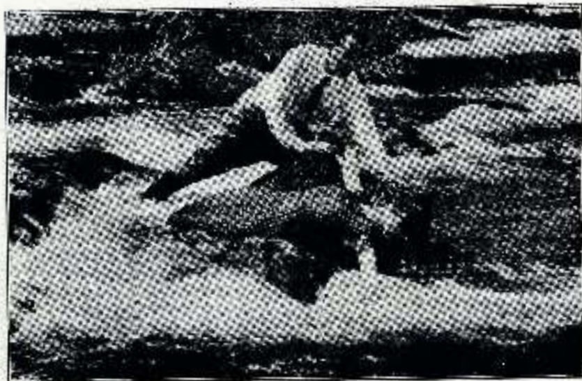
... se apresuró a ir en su auxilio.