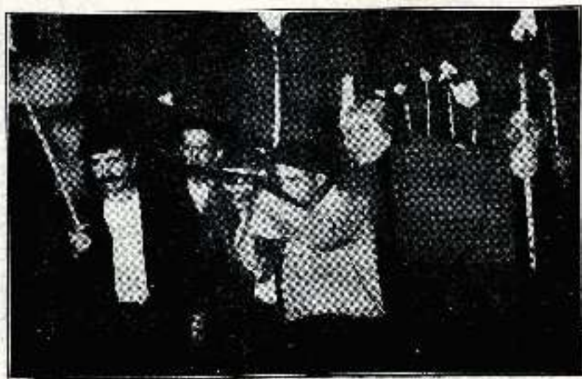
— Dispara; no seas cobarde.

No se tuvo que poner muchas prendas, porque vestía el sencillo traje de marinero.