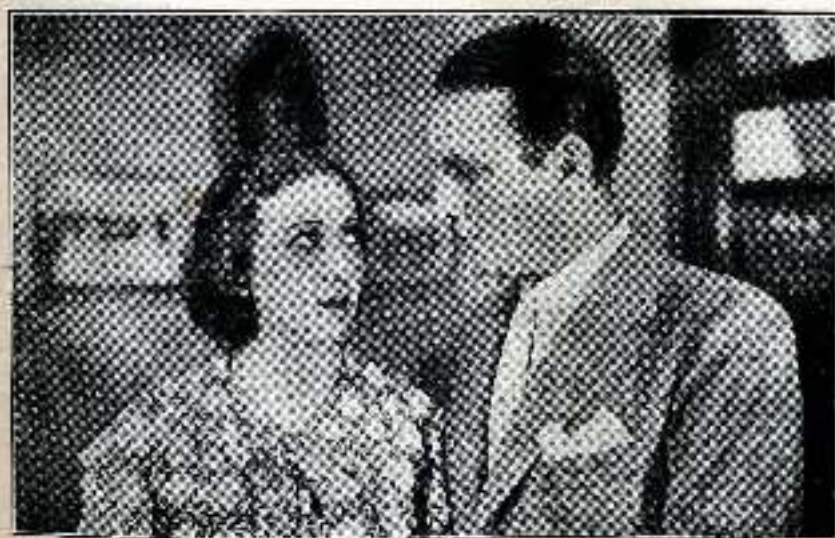
—... ¡No hay nada más hermoso que un árbol!