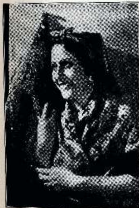
Arminda era una muchacha de unos diez y ocho años...