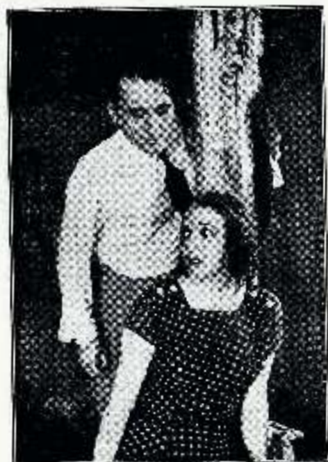
¿Está usted mejor?