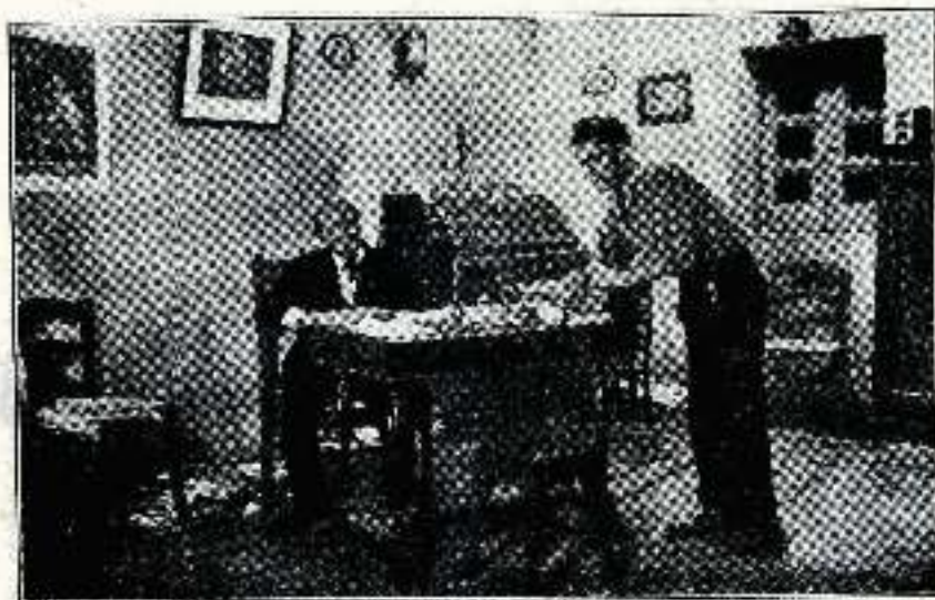
— Ya no espero más.