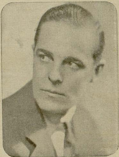
Martel la contempló...

resignarse a perder a Martel... ¡Gracias que no la metía en la cárcel!... ¡Sí, sí, ella probaría de regenerarse, de vivir otra vida... pero seguiría amando