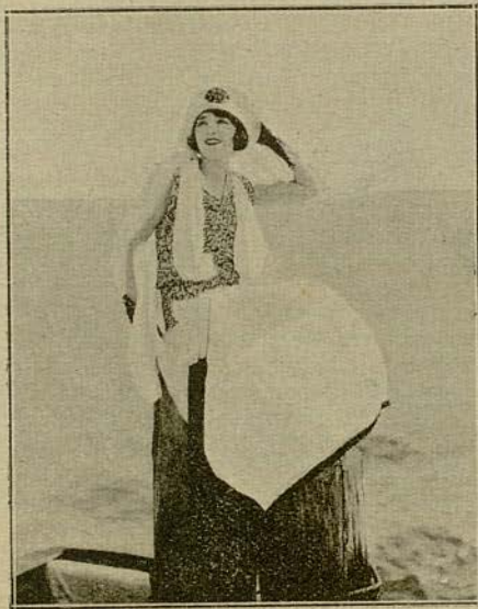
Era el principal encanto de la playa...