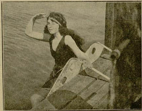
Ronnie estaba ya junto a la costa...

Rogelio paseaba por la playa con un cochecito de mimbre que arrastraba un negro soñoliento. De pronto, el vehículo, chocó suavemente con otro coche