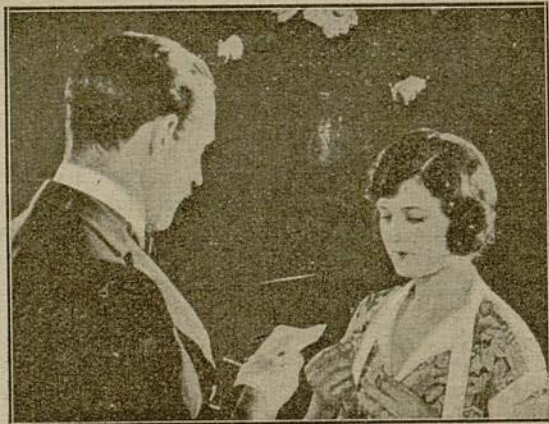
—La carta por la sortija. ¿Le conviene?

Aunque al retirarse Magdalena, Gorman creyó que nadie podría ver la sonrisa de triunfo que asomó a sus labios, alguien le espiaba oculto detrás de las vidrieras de la puerta del jardín. Pedro Delorme había visto llegar a la casa a su antiguo rival en las carreras y deseaba conocer las causas de tan inesperada visita.