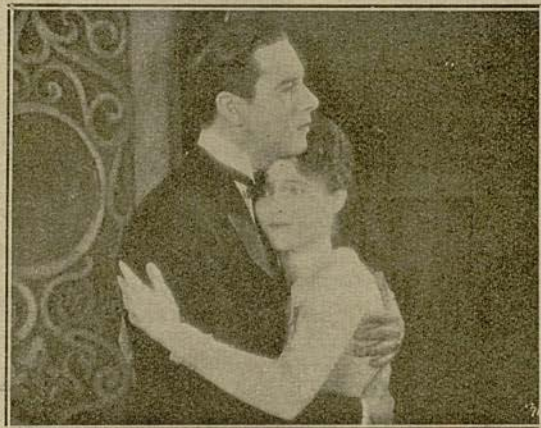
...formando su pareja, estrechamente enlazados...

El coronel Fleming empuñó la pistola. En-