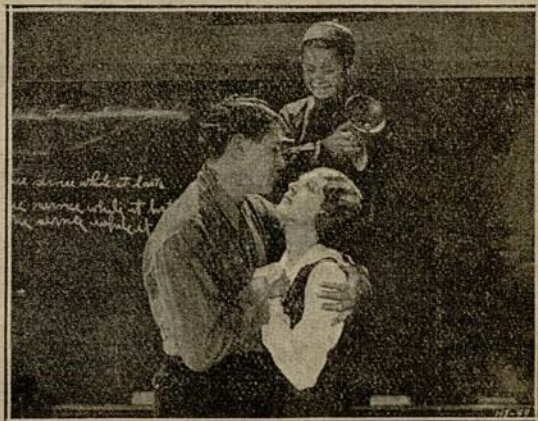
El chino contemplaba a la pareja...

El chino contemplaba a la pareja subido a una silla y con la campanilla de la maestra en las manos, dispuesto a dar un buen campanillazo cuan-