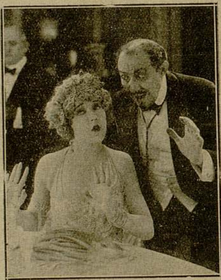
Ella estaba convencida de que era bella y exageraba sus gestos.