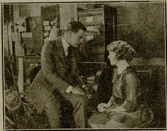
Habló con ella acerca de la imprenta...

Habló con ella acerca de la imprenta; y se enteró de que el periódico, por ser el único del