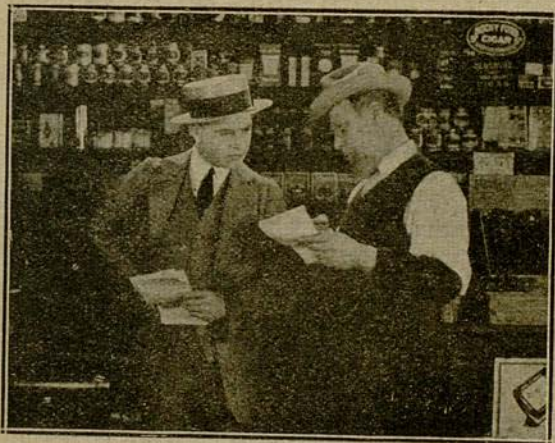
— En Dodson la costumbre es que todos los pagos se hagan en mercancías.

—Usted ha ultrajado a todo el pueblo de Dodson, de modo que hemos resuelto, como protesta general, retirar nuestros anuncios de su periódico, y darnos de baja en la suscripción.