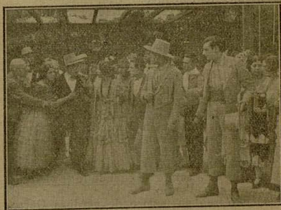
El «Rondeño» abalanzóse al mayoral y la gente se interpuso entre los dos.

No quiso, sin embargo, el señor José poner su confianza en este viaje y procuró alejar la