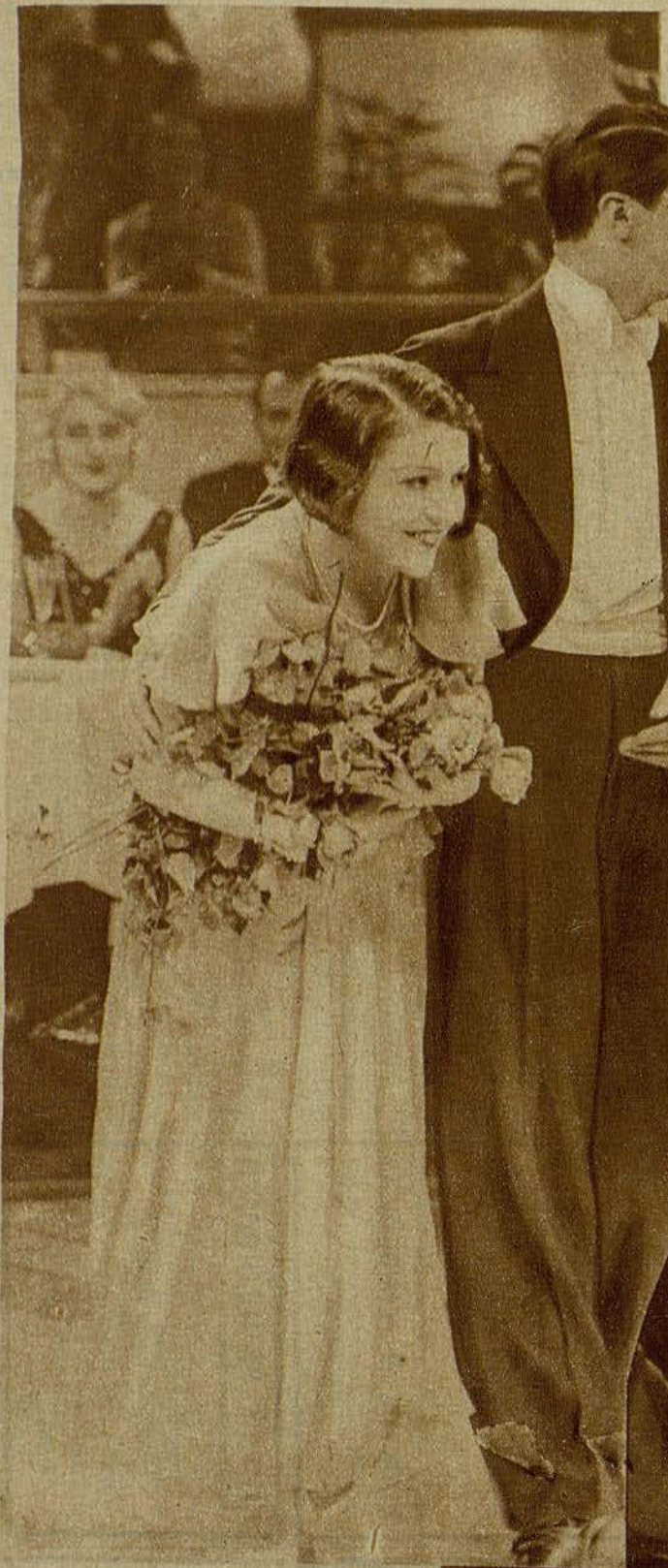
Una escena de la película «S. M. el Amor», que presentará próximamente «Cinés»