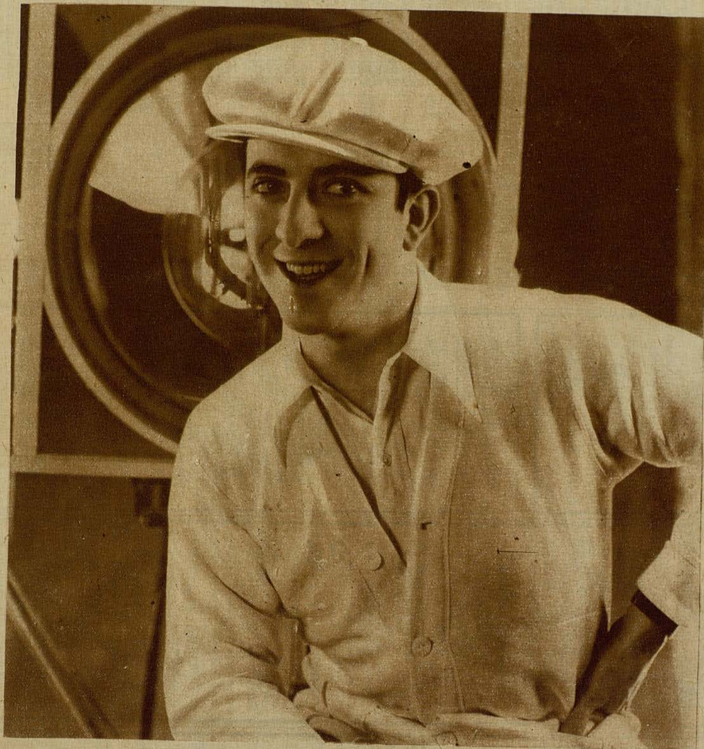
El galán de la Paramount, Roberto Rey, que cuenta tantas simpatias entre el público femenino