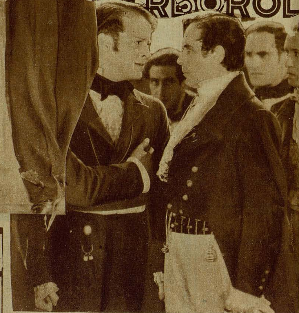
Ernesto Vilches y Barry Norton, en una escena de «El comediante»