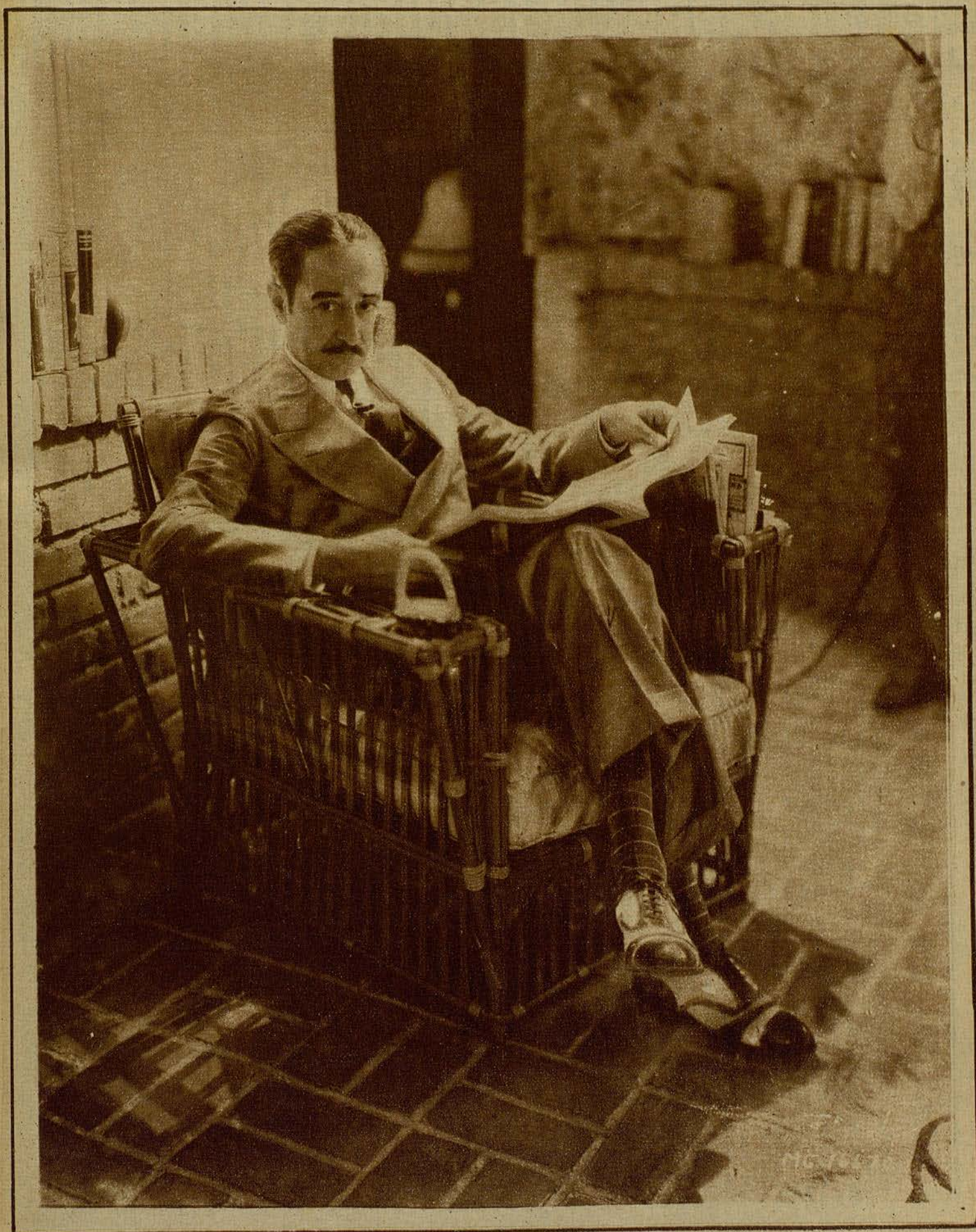
Adolphe Menjou, en el pórtico de su residencia, en Hollywood