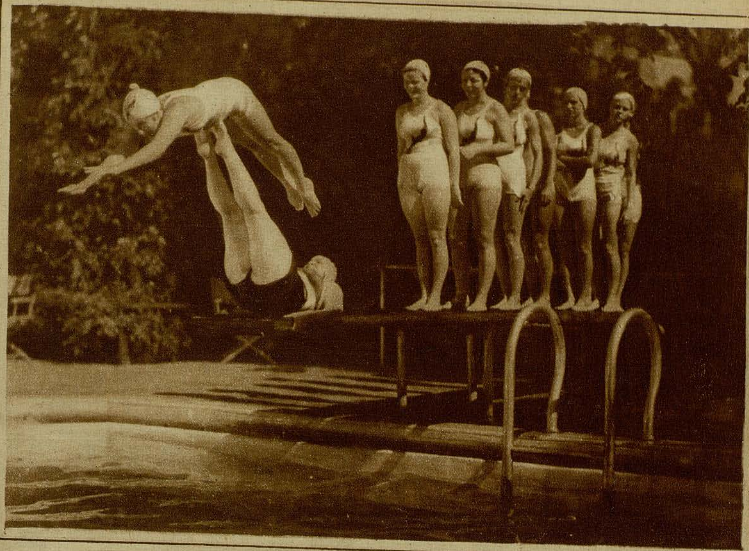
Ved a este grupo de hermosas bañistas entrenándose para filmar una película de natación.