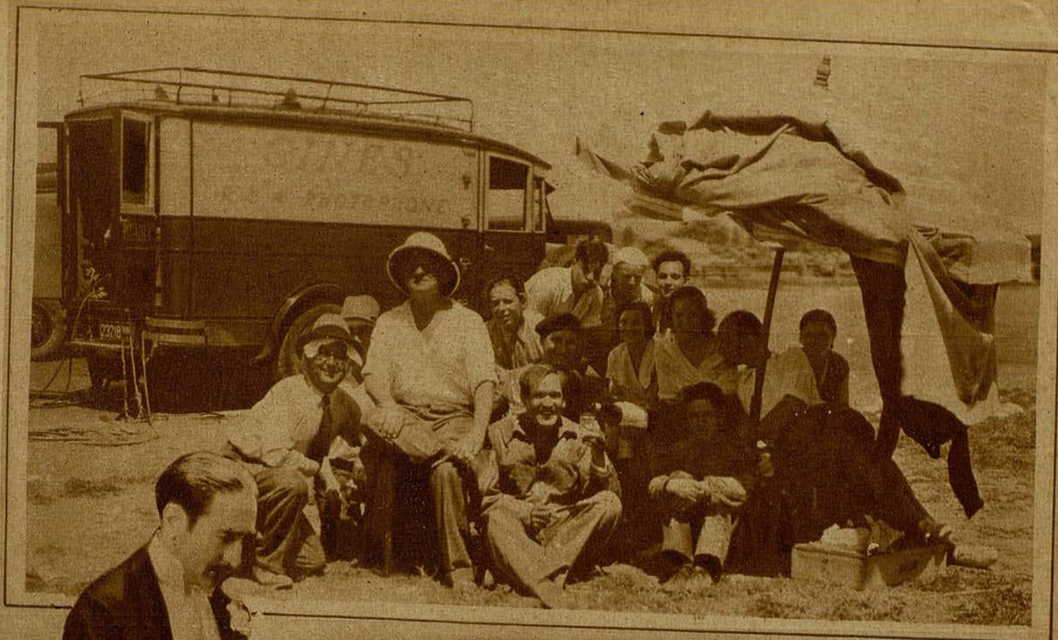
Un grupo de artistas italianos, en un descanso.