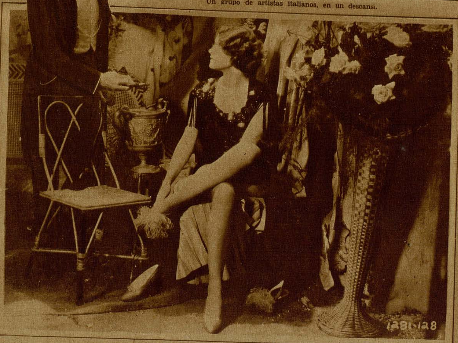
Adolphe Menjou y Marlene Dietrich, en una escena de un film Paramount