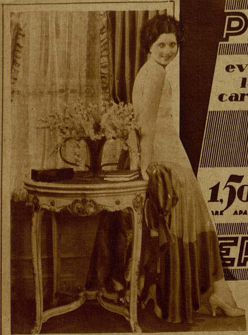
Kay Francis, en la intimidad del hogar