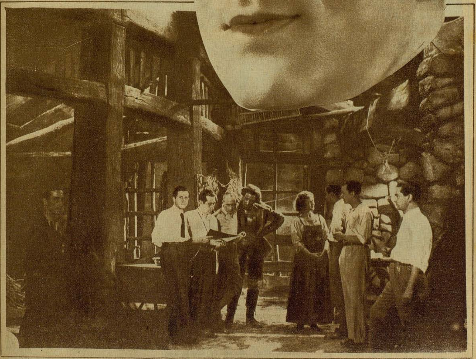
Preparándose para filmar una escena de la película sonora «La Wally»