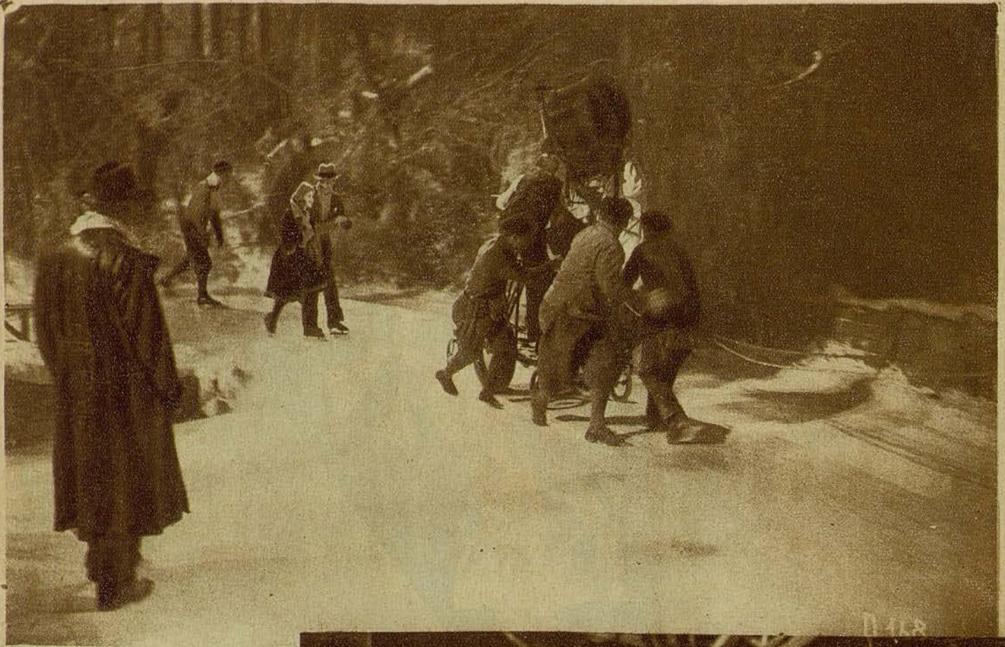
Una demostración de cómo se filman las escenas de noche