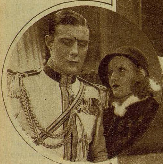
Lilian Harvey y Henry Garat, en «Princesa, a vuestras órdenes»