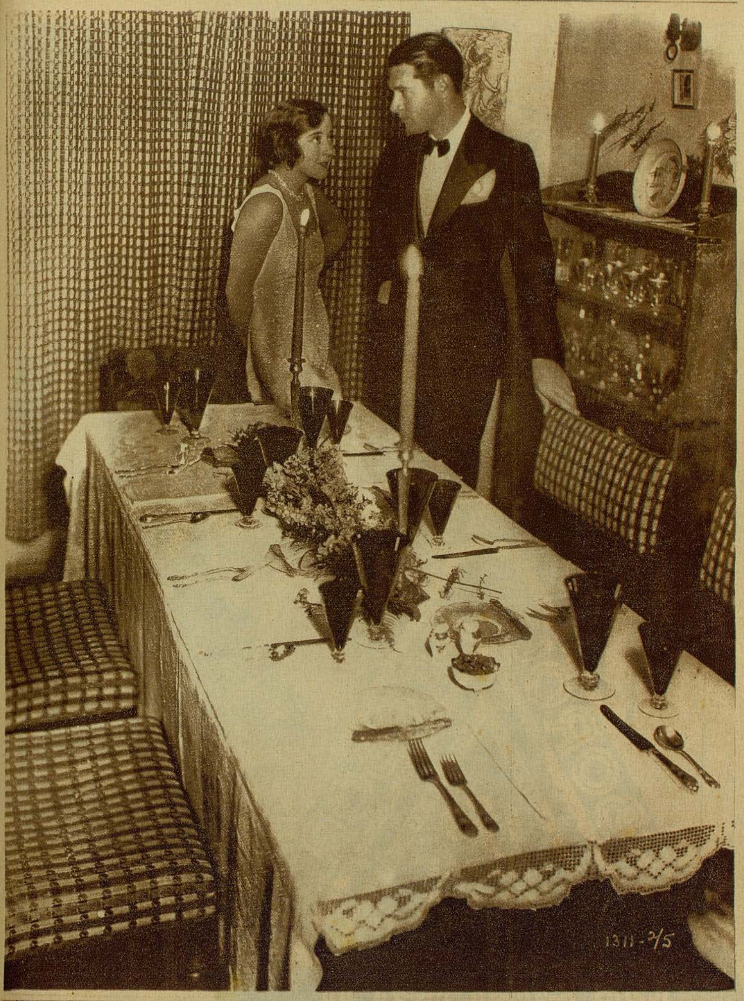
Richard Arlen, en una escena de un film Paramount