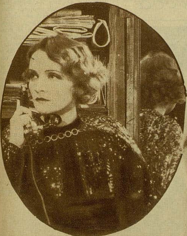
Marlene Dietrich, en «Fatalidad»