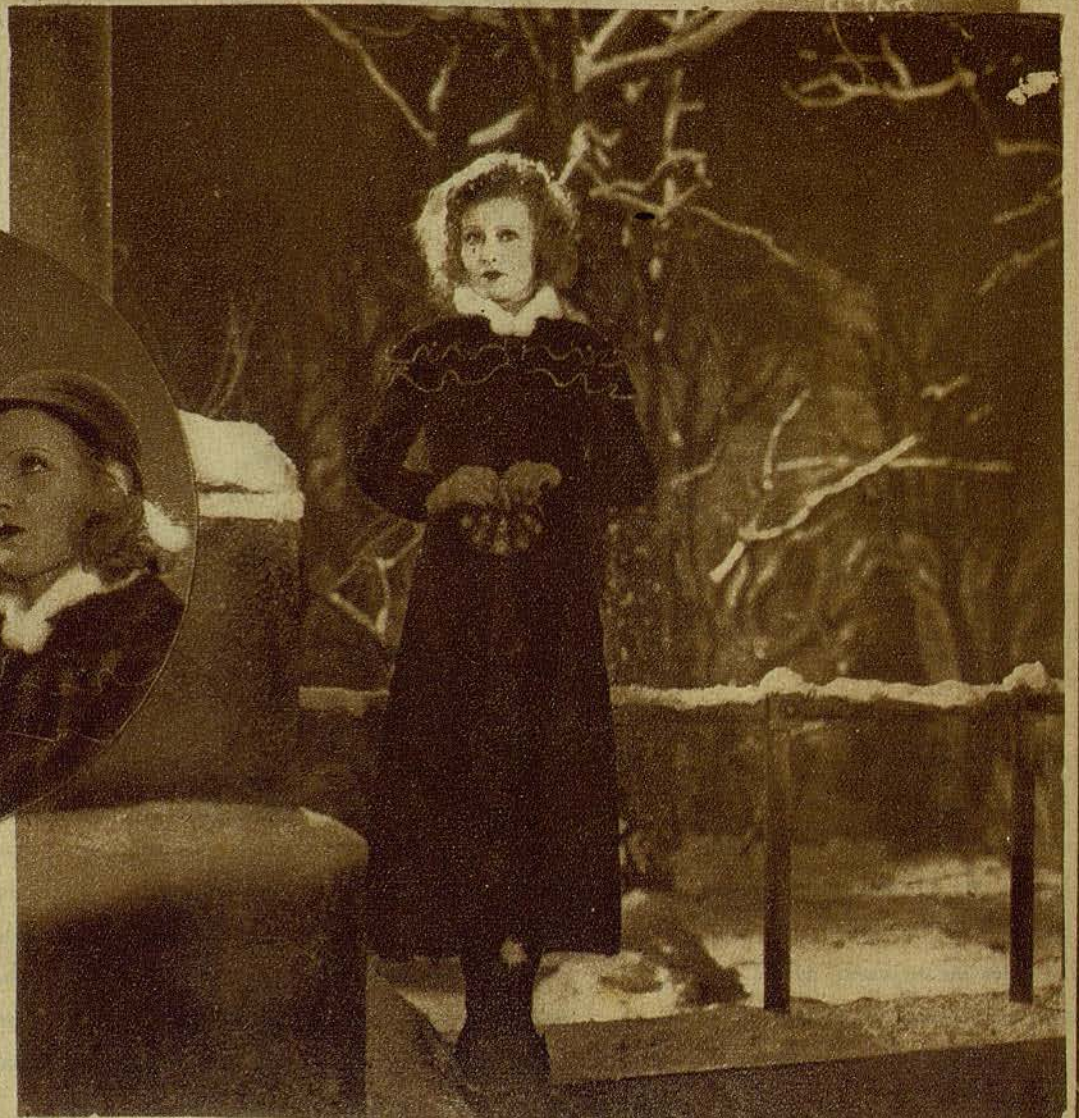
La ingenua vedette Lilian Harvey, que ha renovado su contrato con la Ufa