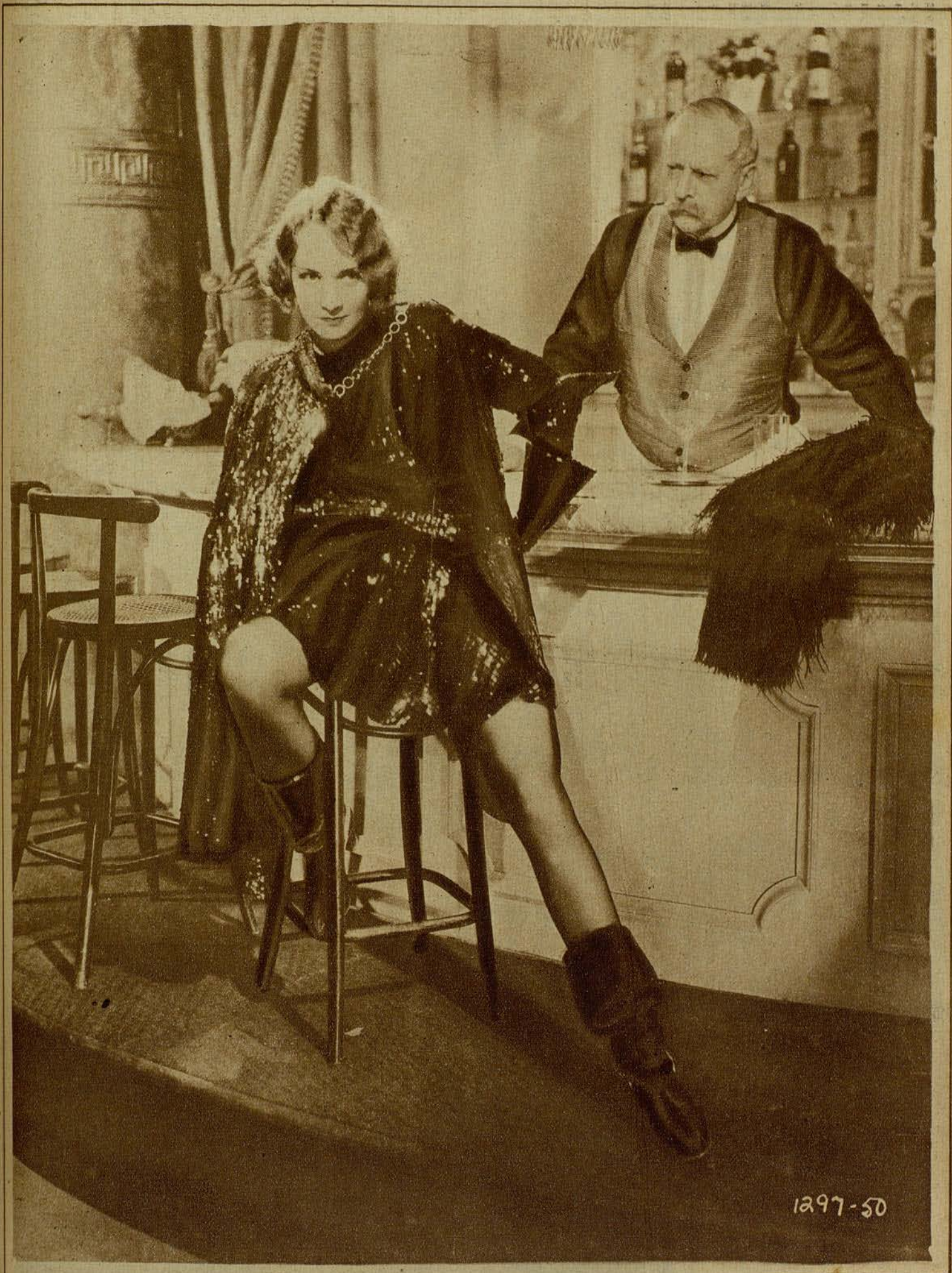
La bella Marlene Dietrich, considerada como la rival de Greta Garbo, en una escena de «Fatalidad»