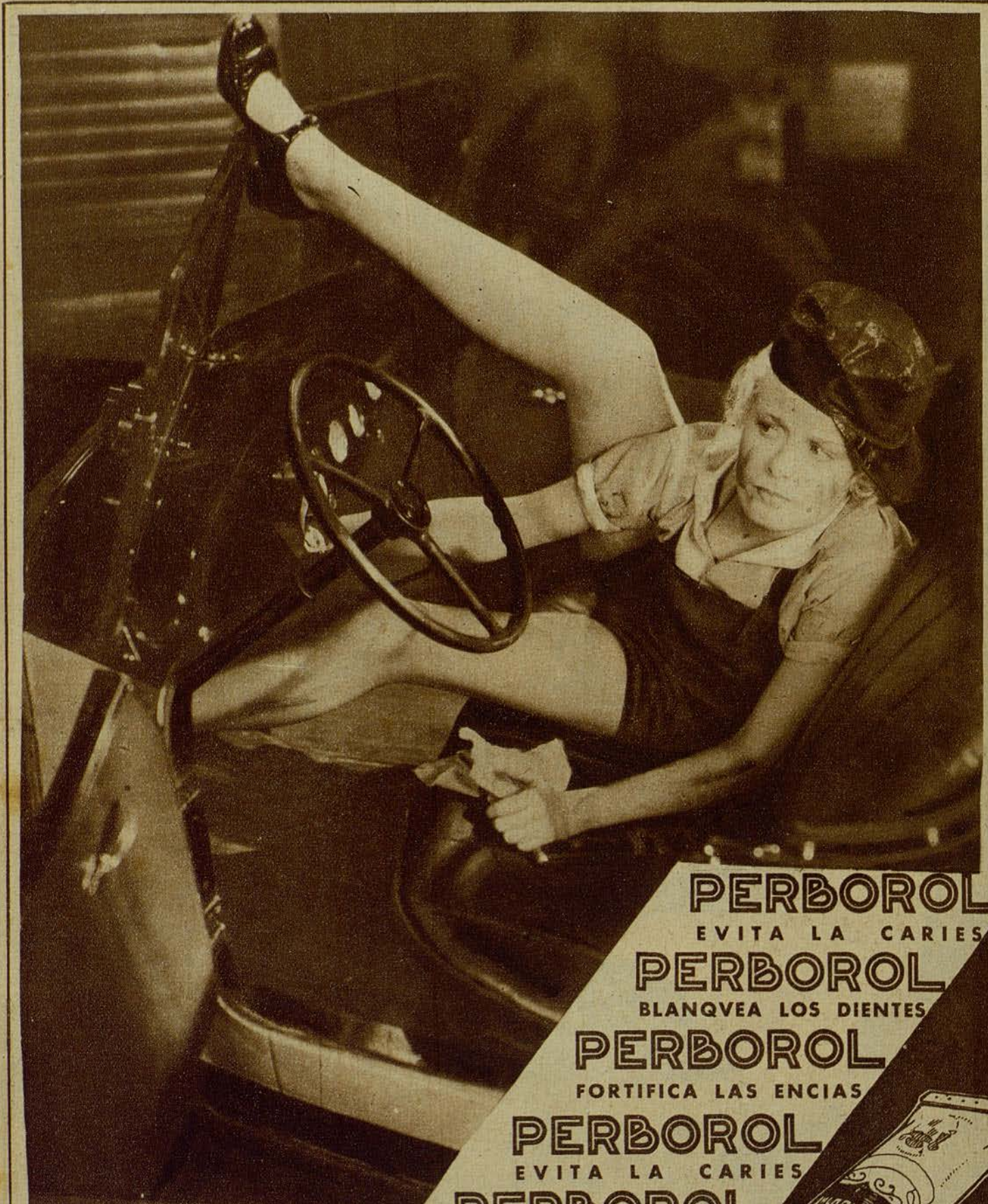
¡Qué curioso! Este freno estaba ayer en perfectas condiciones—exclama Joan Marsh, de la M. G. M., quien, por lo visto, es una mecánico más bonito que hábil