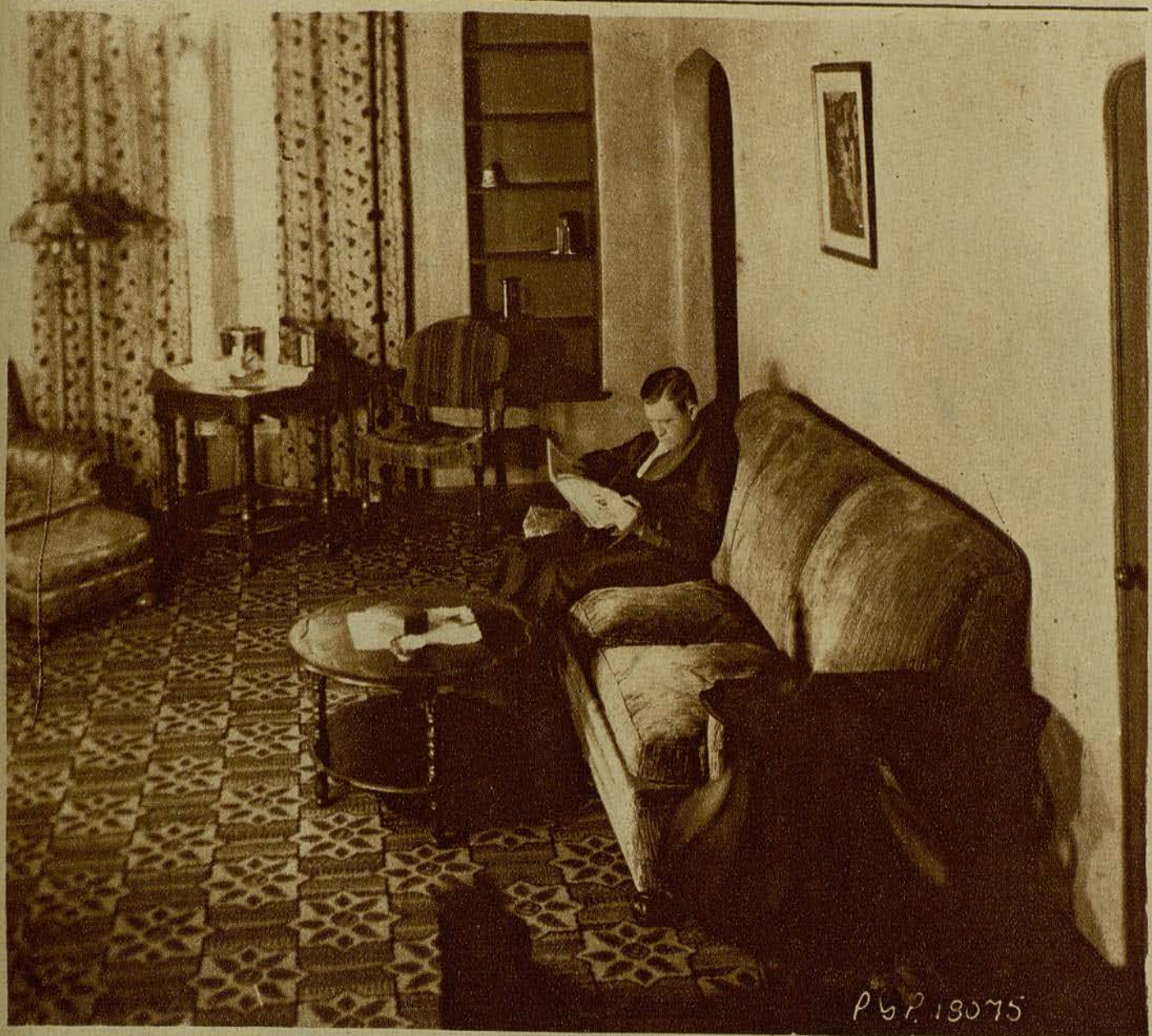
Stuart Erwin, artista de la Paramount, en un momento de reposo en su domicilio de Hollywood