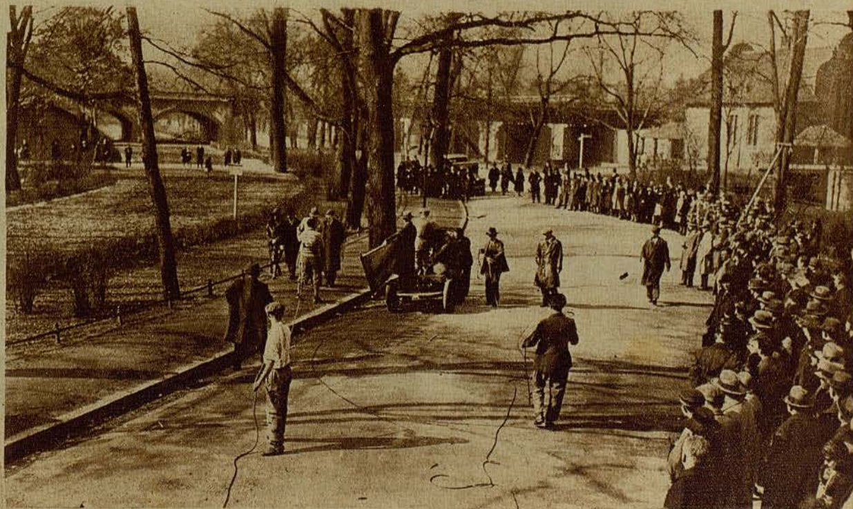
Preparando para filmar una escena sonora de la producción de Enrico Pommer, «El autor de una encuesta»